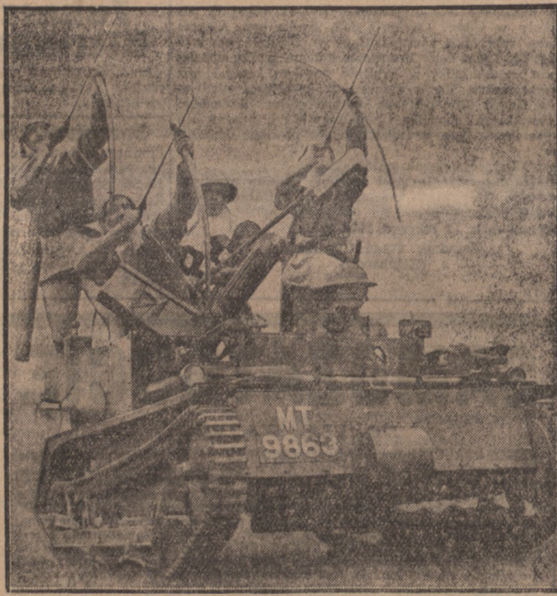
Na zdjęciu naszym widzimy kilku luczników angielskich w kostjumach z epoki Henryka VI na nowoczesnym czołgu.