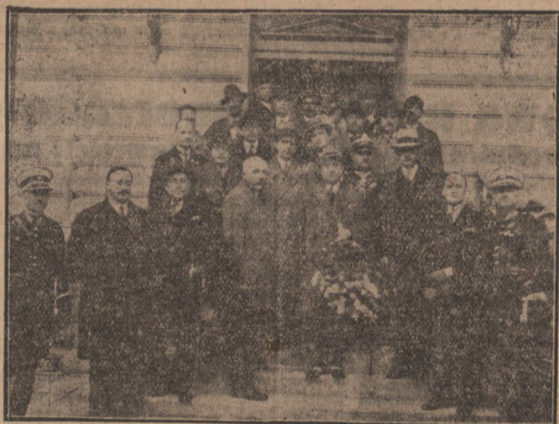
Wycieczka parlamentarzystów jugosłowiańskich, złożona z kilkunastu członków Skupczyny i Senatu z ministrem Andjelinovicem na czele od kilku dni bawi w Polsce. Przybyłych do Polski parlamentarzystów jugosłowiańskich powitała delegacja komisji spraw zagranicznych Sejmu Rzplitej. — Na zdjęciu naszym widzimy uczestników wycieczki przed dworcem w Krakowie