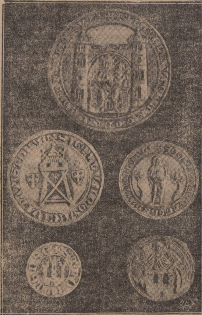
Na zdjęciu naszym podajemy 5 pieczęci miasta Torunia: 1) pieczęć starego miasta Torunia z czasów około roku 1300 (Małka Boska na tronie) 2) pieczęć nowego miasta Torunia również z czasów około 1300 (Baszjon drewniany), 3) pieczęć sekretną miasta Torunia z 14 wieku (z wizerunkiem św. Jana Chrzciciela), 4) pieczęć starego miasta Torunia z 15 wieku (brama trzywieżowa) i 5) pieczęć miasta Torunia po złączeniu obu miast, starego i nowego z czasów Kazimierza Jagiellończyka tj. z roku 1470, używana do tąd (Anioł z tarczą herbową).