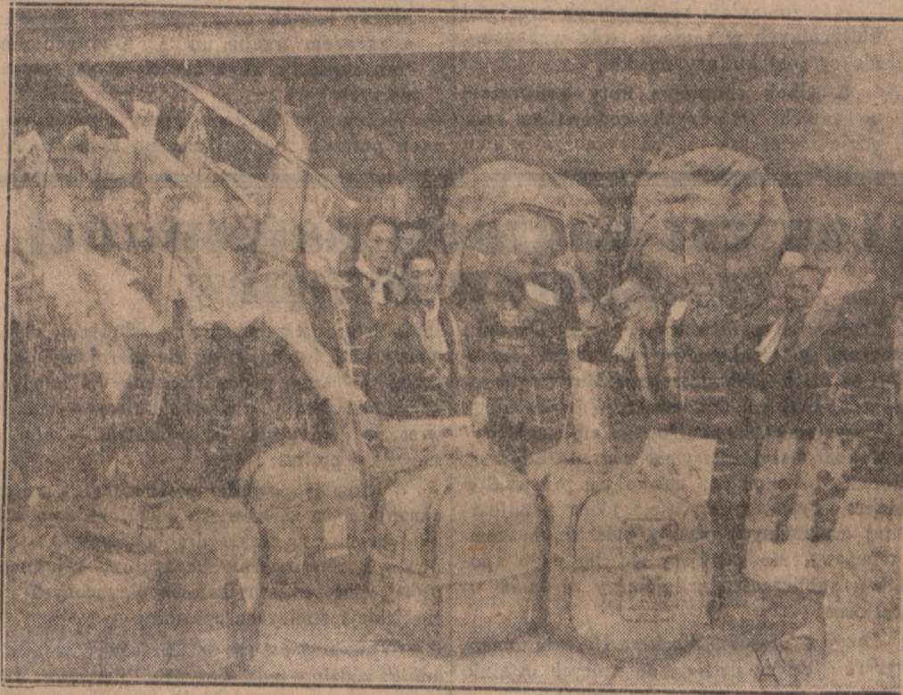
Narodowym trunkiem japońskim jest wódka sake, pędzona z ryżu. Na zdjęciu naszym widzimy transport tej wódki w oryginalnym opakowaniu, przeznaczony do wysyłki na prowincję.