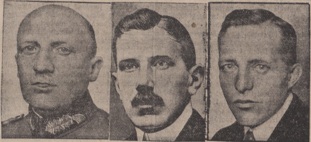
U góry od lewej strony: hr. Kalkreuth, b. minister Reichswehry Gessler, ambasador von Neurath, hr. Westarp. W dolnym rzędzie general von Schleicher, desygnowany na kanclerza Rzeszy von Papen i hr. Schwerin - Krossigk.

ambasadorem, niemieckim przy Kwirynale, poczem wyjeżdża do Londynu na dotychczas zajmowane stanowisko ambasadora.