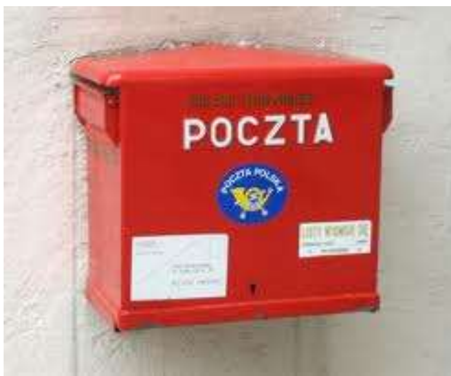
Polska skrzynka pocztowa.