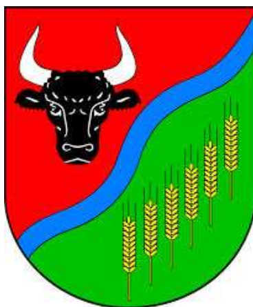
Herb Powiatu Grudziądzkiego