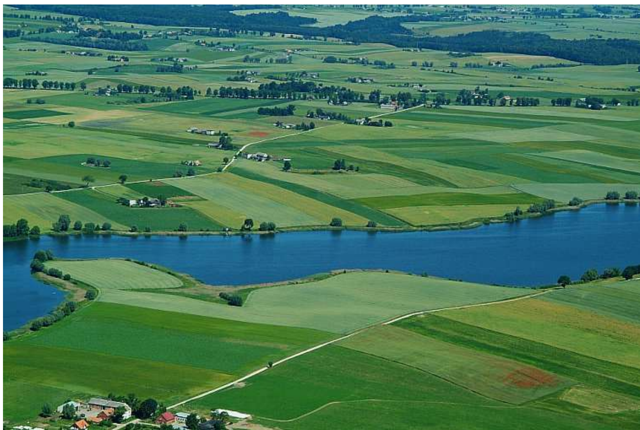
Okolice Grudziądza z lotu ptaka.