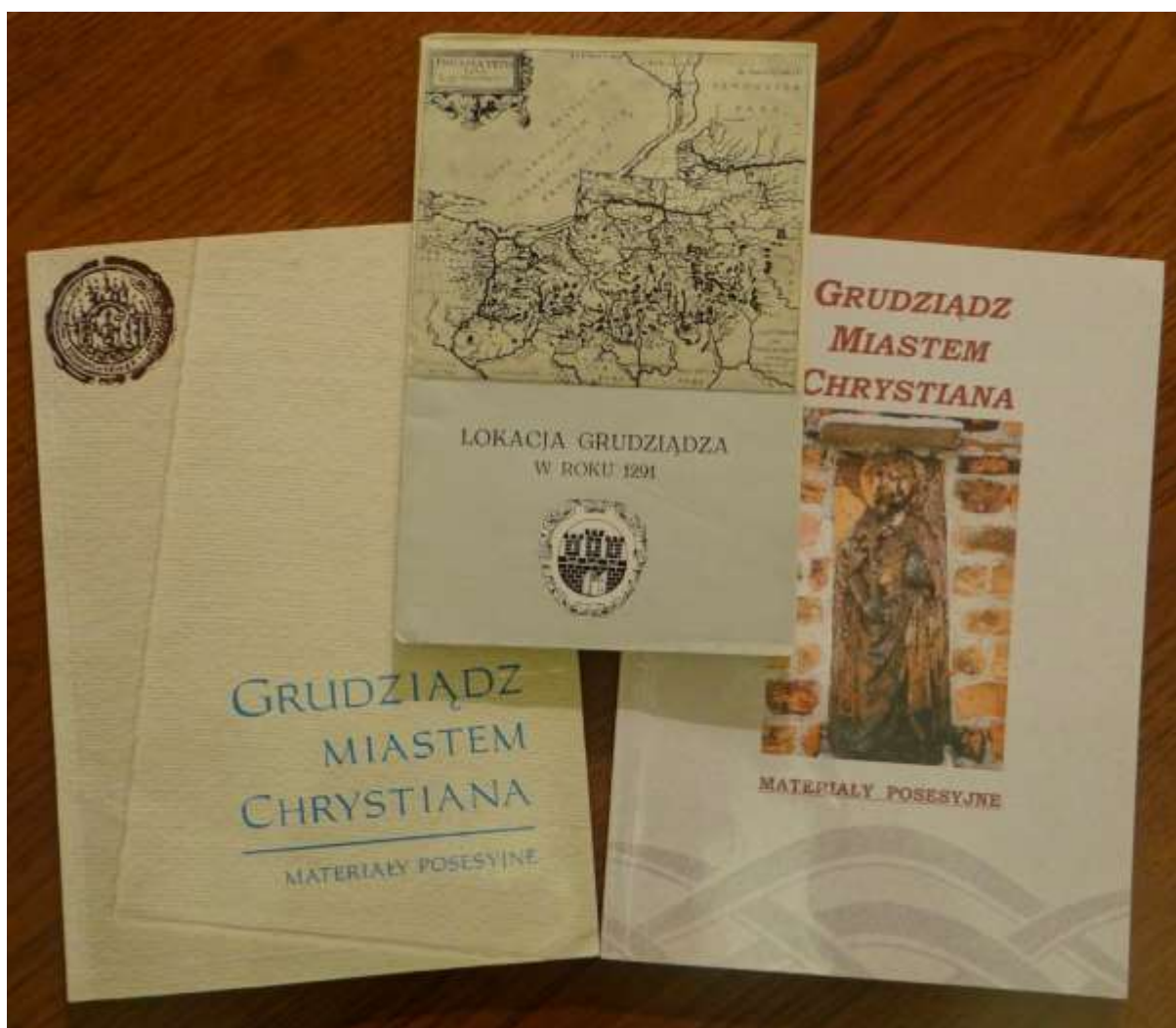
Publikacje o biskupie Chrystianie