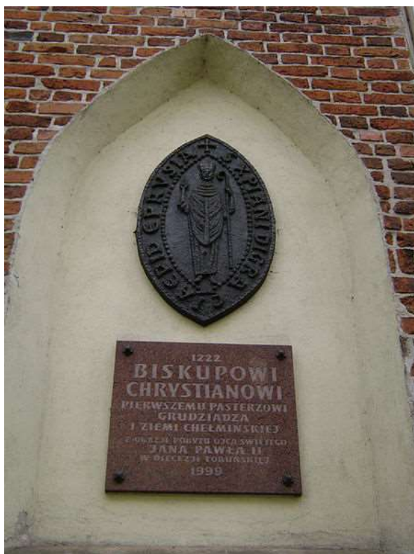
Tablica pamiątkowa poświęcona biskupowi na ścianie kościoła farnego w Grudziądzu

Jego podobizna widnieje na herbie miast Lubawy i Grudziądza.