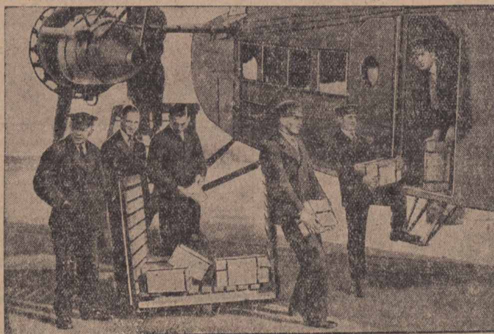
O silnym wzroście zaufania Anglii do papierowego funta ssterl. świadczy wydane niedawno cofnięcie zakazu wywozu złota. Od pewnego czasu złoto angielskie znowu wędruje zagranicę kraju, głównie do Francji, na pokrycie długów angielskich zagranicą. Przewóz złota odbywa się przeważnie drogą powietrzną.