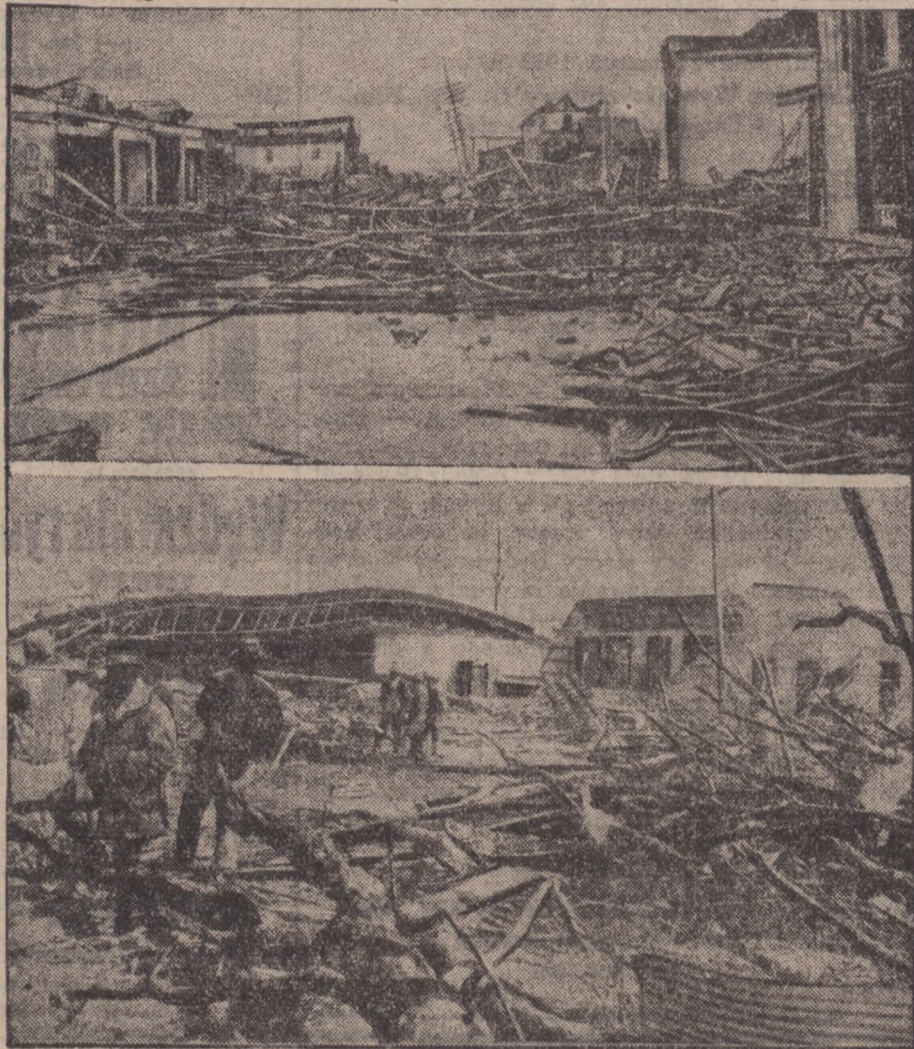
W południowych Stanach Zjednoczonych szczególnie w stronach Alabamy i Missisipi szalał wczoraj straszliwy orkan, który wyrządził olbrzymie szkody. Trąba powietrzna zniszczyła kilka miejscowości doszczętnie. Pod gruzami zawalonych domów zostało kilkaset osób zabitych.