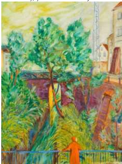
Nad Trynką 1979 r.