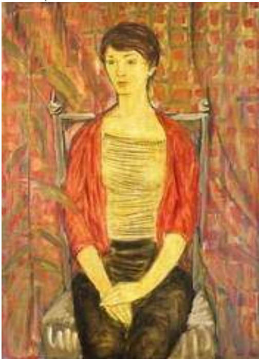
Portret żony 1960 r.