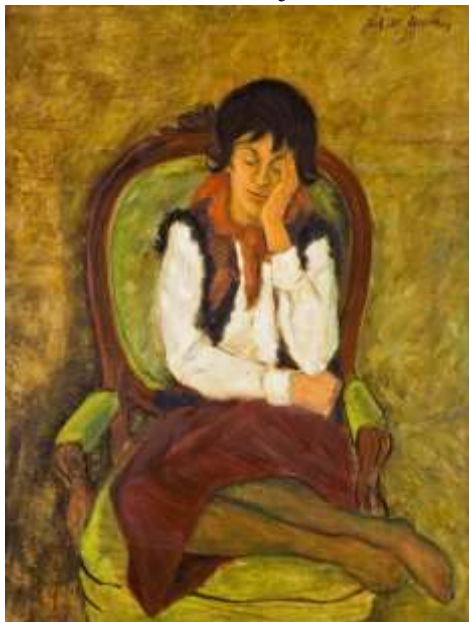
Zamyślona 1981 r.

Samodzielną działalność artystyczną rozpoczął po ukończeniu studiów w 1960 r.