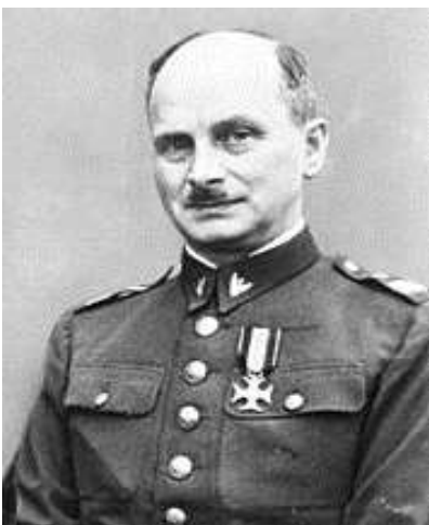
Gen. bryg. Kazimierz Sawicki.

W Grudziądzu funkcjonował duży garnizon wojskowy z gen. Kazimierzem Sawickim – komendantem garnizonu w latach 1932-1938 i dowódcą 16 dywizji.