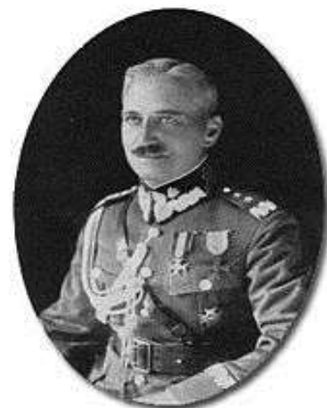
Gen. bryg. Kazimierz Ładoś.

W okresie 1934-1935 koło posiadało 7 szybowców i wyszkoliło 41 pilotów szybowcowych kat. A, z których zapewne wielu walczyło jako piloci wojskowi w II wojnie światowej.