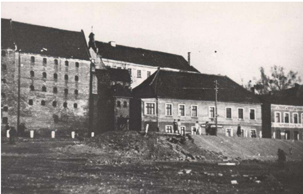
Plac promowy z restauracją "Pod Kotwicą".

Z okazji jubileuszu 25-lecia Towarzystwa 11 maja 1935 r. w Teatrze Miejskim odbyła się akademie jubileuszowa połączona występami chóru i orkiestry wojskowej 64 p.p.