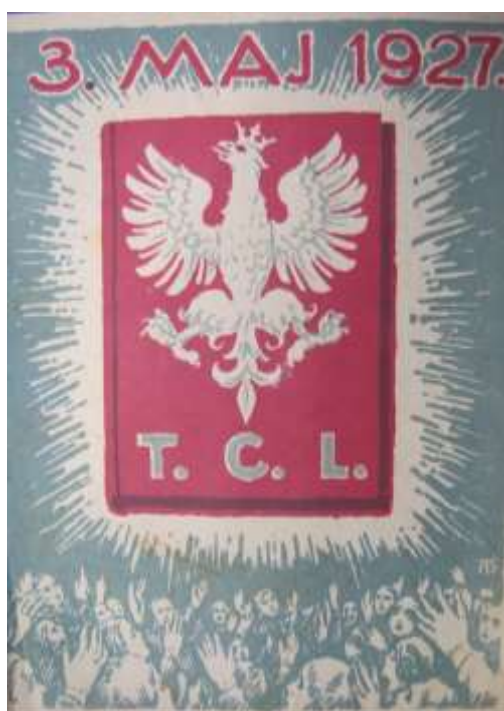
Plakat TCL z okazji Święta 3 maja.