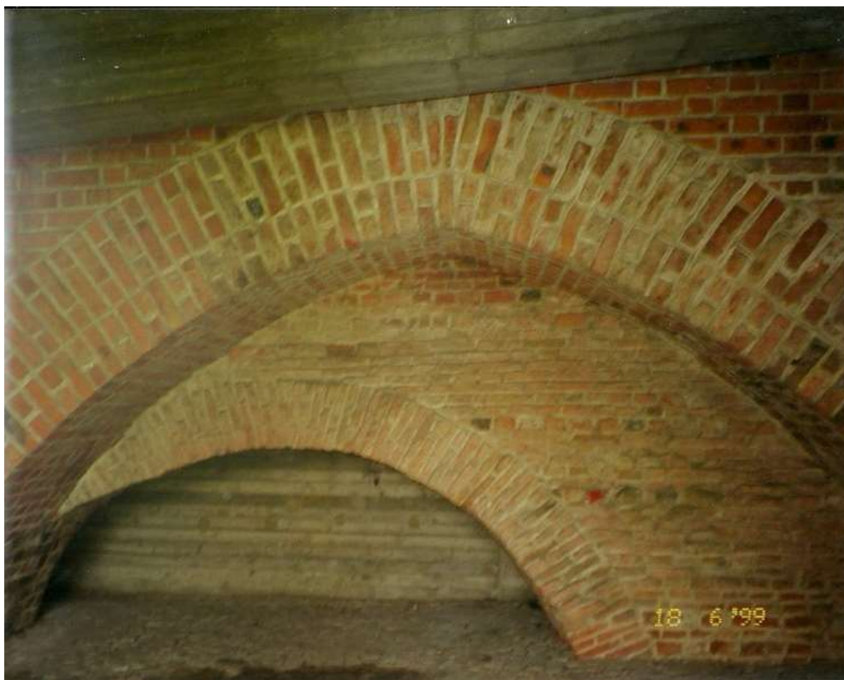
Most Bramy Krakowskiej na Placu Zamkowym w Warszawie.

Szczególne znaczenie dla Warszawy ma gotycki most na Placu Zamkowym, którego odpowiednik znajduje się w Grudziądzu. Budowę tych mostów można datować na XIII w. W wypadku Warszawy jej rozplanowanie można wiązać z osobą księcia Konrada Mazowieckiego, który w 1241r. wymienił pierwszy raz Warszawę w dokumencie.