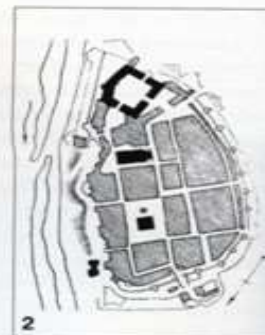
1.2. Plany średniowiecznych miast: Grudziądza (1) i Warszawy (2)