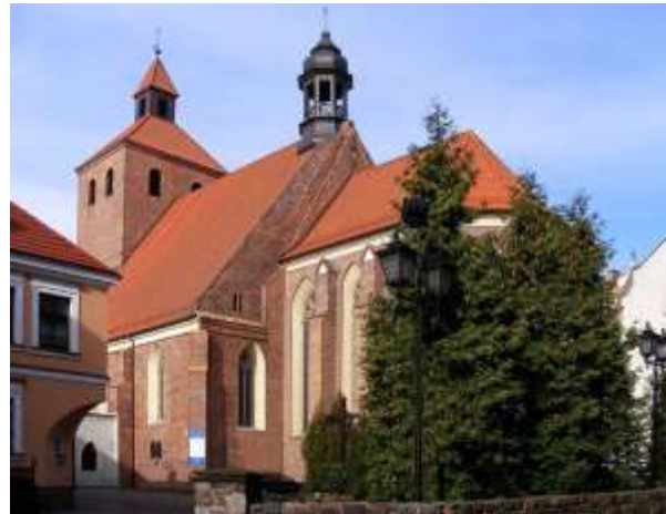
Widok na kościół św. Mikołaja w Grudziądzu od strony Rynku.