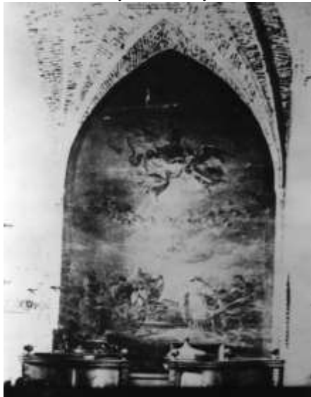
Baptysterium z romańską chrzcielnicą w zachodniej części nawy południowej. Stan sprzed 1939 r.

wody. Miał on je chronić przed zanieczyszczeniem i zatruciem. W Piśmie Świętym o lwach mówi się ponad sto razy. Chrystus jest określany mianem Lwa z pokolenia Judy. Aż do czasów średniowiecza porównanie Chrystusa do lwa wzmacniała wiara w specyficzne narodziny lwiątek. Miały one rodzić się martwe i dopiero po trzech dniach stary lew rykiem budził je do życia. Stąd prosta analogia do Zmartwychwstania Chrystusa po trzech dniach za sprawą mocy Boga – Ojca. W tym znaczeniu lew – symbol Zmartwychwstałego Chrystusa jest w tamtej epoce powszechny. Włosy natomiast, w tym przypadku lwie grzywy, w sztuce średniowiecznej były symbolem siły vitalnej. Głowy zarówno ludzkie, jak i zwierzęce z długimi włosami, umieszczone na chrzcielnicach romańskich były wyrazem odrodzenia człowieka mocą Ducha Świętego poprzez sakrament Chrztu Św. Były one znakiem siły nadprzyrodzonej, która zwyciężyła zło. Wizerunek smoka natomiast w tradycji chrześcijańskiej jest symbolem szatana i jego potęgi. W średniowiecznej