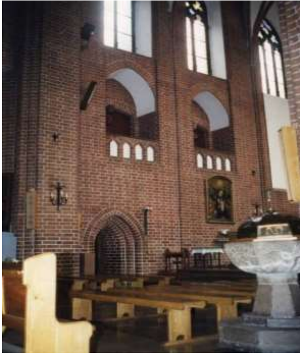
Obecna lokalizacja chrzcielnicy przy łuku tęczowym obok prezbiterium.