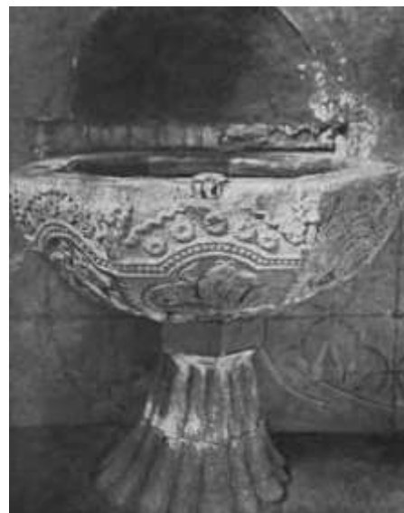
Chrzcielnica romańska w 1928 r.

Ornamentykę figuralną świata zwierzęcego na czarze chrzcielnicy reprezentują lwy, połączone długimi grzywami oraz smoki. Lew, jako symbol posiada rodowód starożytny. Był uznawany za króla zwierząt. Odzwierciedla siłę i majestat królewski. Przedstawiony w walce z dzikiem albo wężem był alegorią walki dobra ze złem. Starożytni Grecy uważali go za stróża źródeł