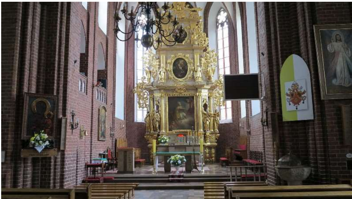
Widok na prezbiterium kościoła św. Mikołaja w Grudziądzu. Po prawej stronie umieszczono chrzcielnicę romańską.