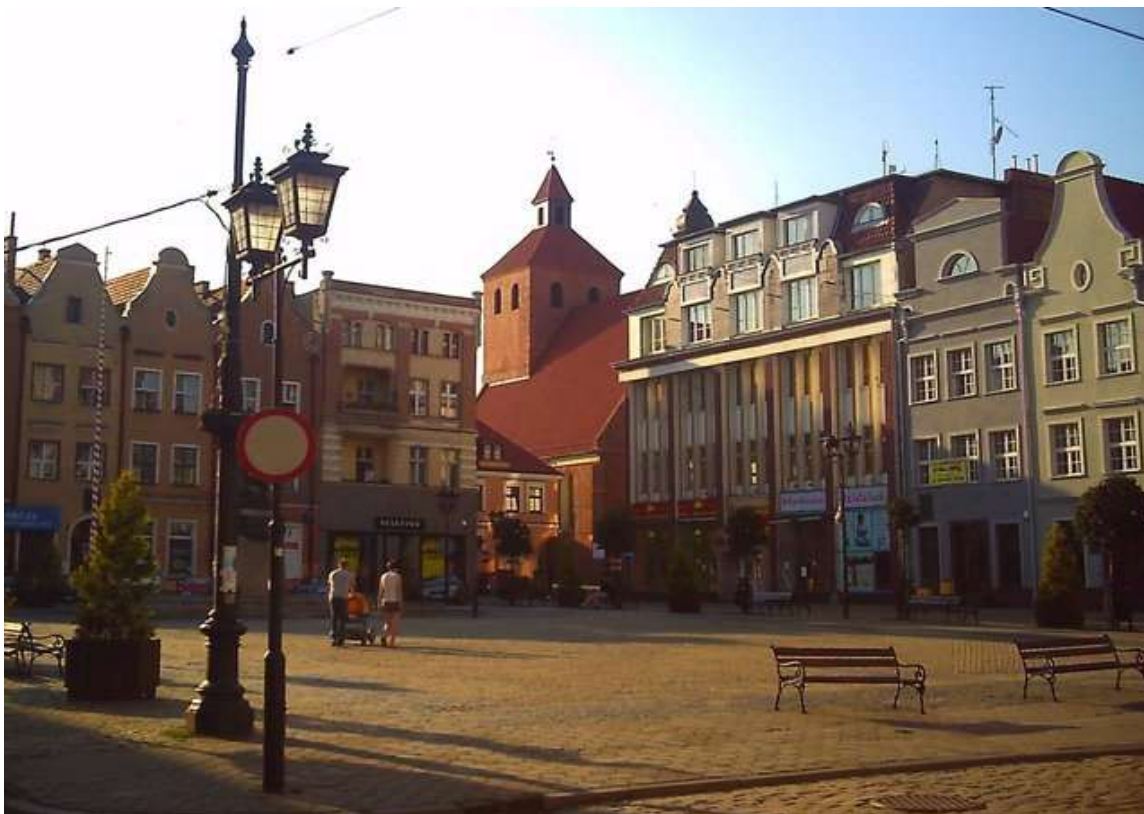
Widok na Rynek w Grudziądzu oraz kościół św. Mikołaja.