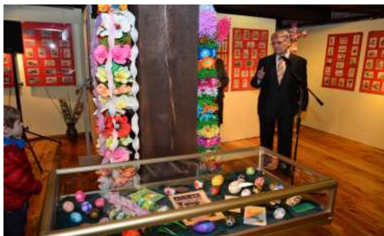
Fot. 3. Palmy kurpiowskie oraz gablota z pisanekami, kartkami i czasopismem „Płomyk” z 1935 r.