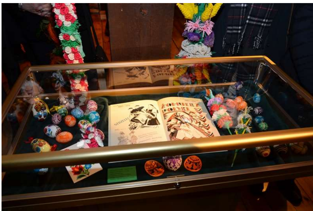
Fot. 2. Gablota z pisanekami oraz pozycją „Wesołego Alleluja. Święta Wielkiej Nocy” w zbiorach Centralnej Biblioteki Wojskowej im. Marszałka Józefa Piłsudskiego” Warszawa 2012.