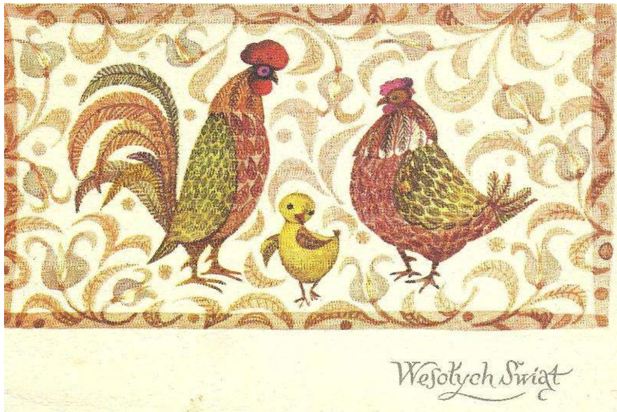
Fot. 7. Poczтівka Hanny Balickiej-Fribes.