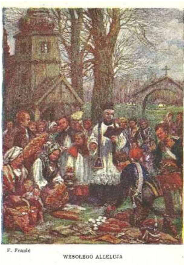
Fot. 6. Poczтівka z 1935 r. z kolekcji M. Sołobodowskiego.