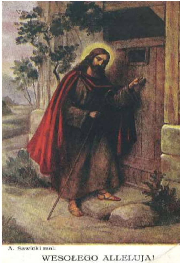
Fot. 8. Pocztówka A. Sawickiego.