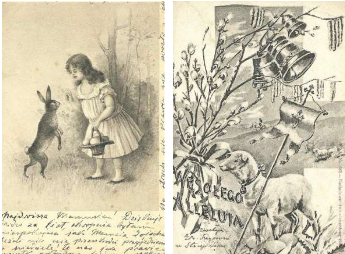
Fot. 4. Pocztkówki z 1904 r. z kolekcji M. Sołobodowskiego.