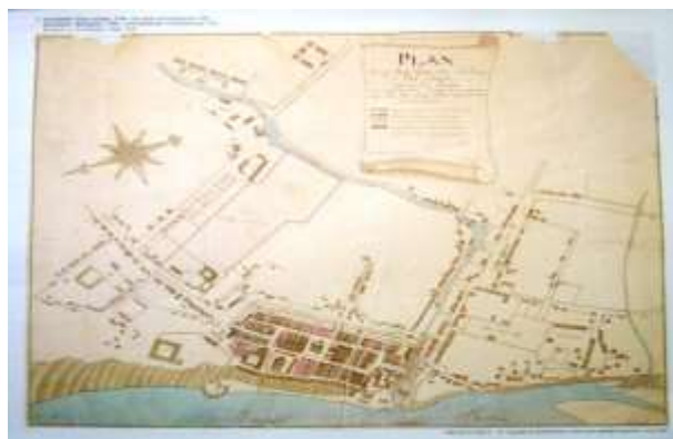
Rys. 3. „Kopia W. Giesego planu z 1781 r.”

W swojej rekonstrukcji zagospodarowania przestrzennego Grudziądza J. Frycz oparł się również na rzekomej kopii planu 1781 r., tzw. Kopii W. Giesego, (rys. 3). Jest to faktycznie plan rekonstrukcyjny z 1910 r., będący stylizowaną kompilacją kilku planów 11 .