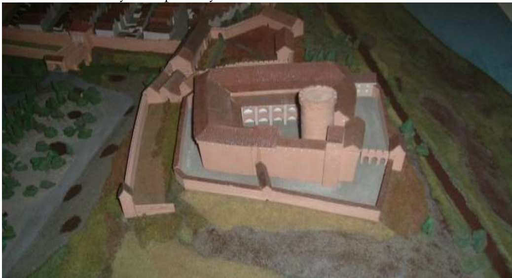
Rys. 1. Zamek wysoki od strony północnej. Fragment makiety współautorstwa J. Frycza.

Był to pierwszy w polskiej historiografii artykuł komasujący tyle kwestii badawczych jednocześnie. Powszechna dostępność Rocznika Grudziądzkiego zapewne sprawiła, że wyniki badań innych badaczy stały się mniej znane, dotyczy to m. in. datacji murów obronnych i spichrzy nadwiślańskich 9 .