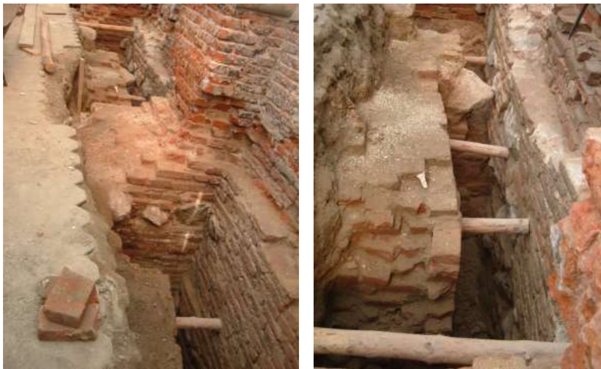
Rys.6-7. Fundament kościoła pojezuickiego od strony ul. Ratuszowej. 2006 r.

Plany te pokazują, że na przełomie XVII/XVIII w. nie było ul. Ratuszowej. Kościół św. Mikołaja przylegał do murów kolegium. Informację tę potwierdziły wykopy w 2006 przy fundamentach kościoła pojezuickiego, (rys.6-8). Do fundamentów kościoła przylegały zapewne fundamenty rozebranych przy końcu XVIII w. kaplic kościoła św. Mikołaja.