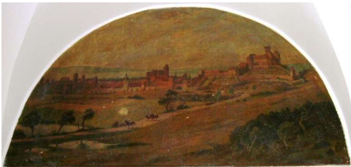
Rys. 8. Wyjazd Krzyżaków z zamku. Malarz nieznanym 22 .

Również na początku XX w. w wizji artystycznej brano pod uwagę bezkolejny wjazd do Zamku Wysokiego od strony północnej, (rys. 9).