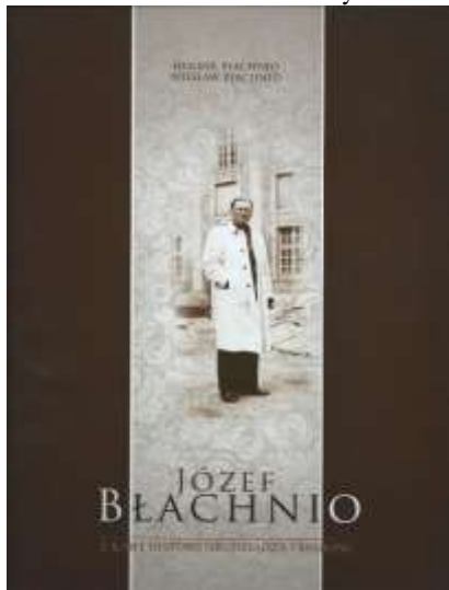
Okładka albumu o Józefie Błachnio.

Treść albumu zawarta jest w 17 rozdziałach stanowiących pewną zamkniętą ramami czasu i tematyki całość: