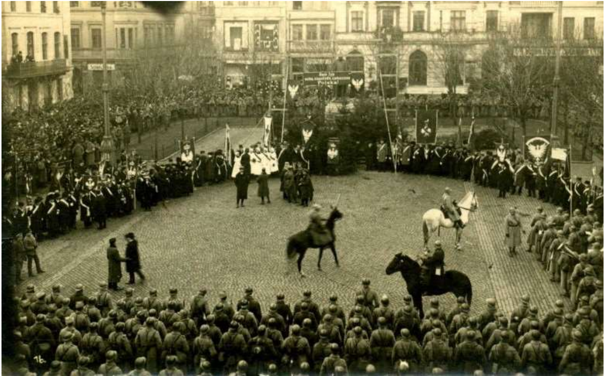
Powrót Grudziądza 23 stycznia 1920 r. do Macierzy.

powiat Leon Ossowski, nowy nadburmistrz miasta i inni. Po powitaniu, długim pochodem wojska ruszyły w kierunku Rynku Głównego, gdzie później, po dotarciu