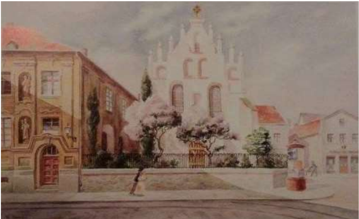
Pałac Opatek i kościół św. Ducha w Grudziądzu.