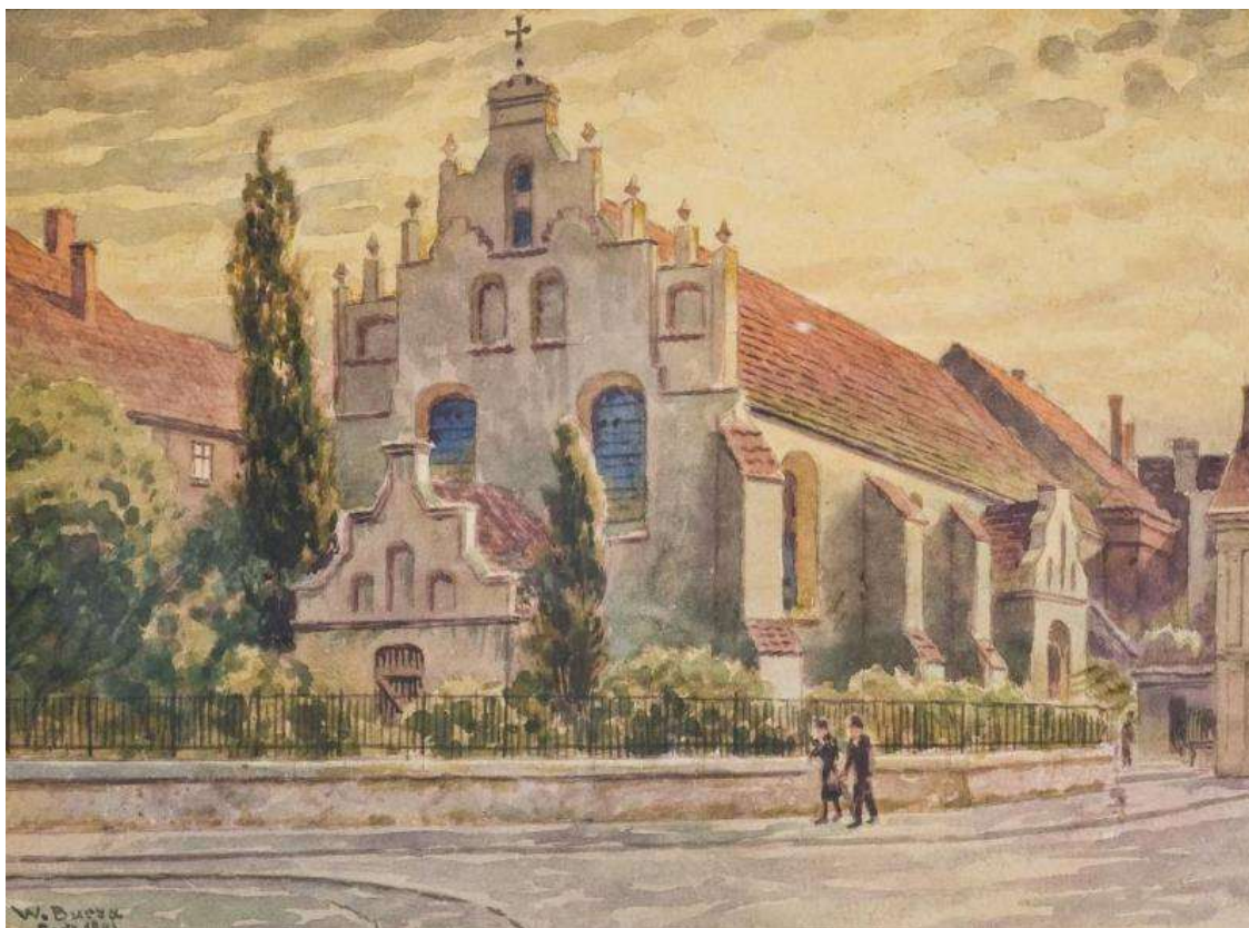
W. Burza, Kościół św. Ducha w Grudziądzu.