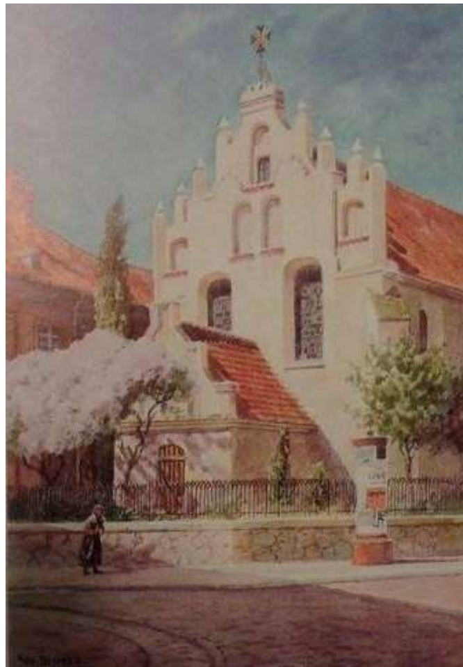
Kościół św. Ducha w Grudziądzu.