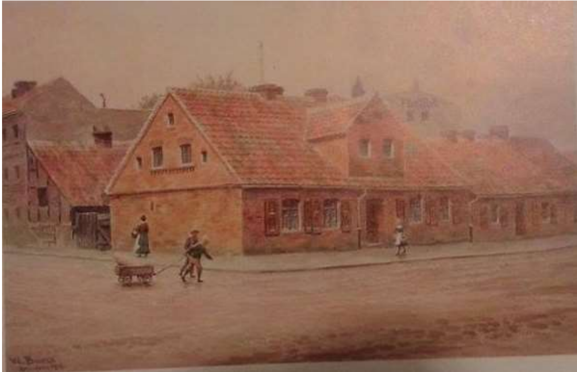
Ulica Bracka (obecnie Marcinkowskiego róg Rybackiej) w Grudziądzu.