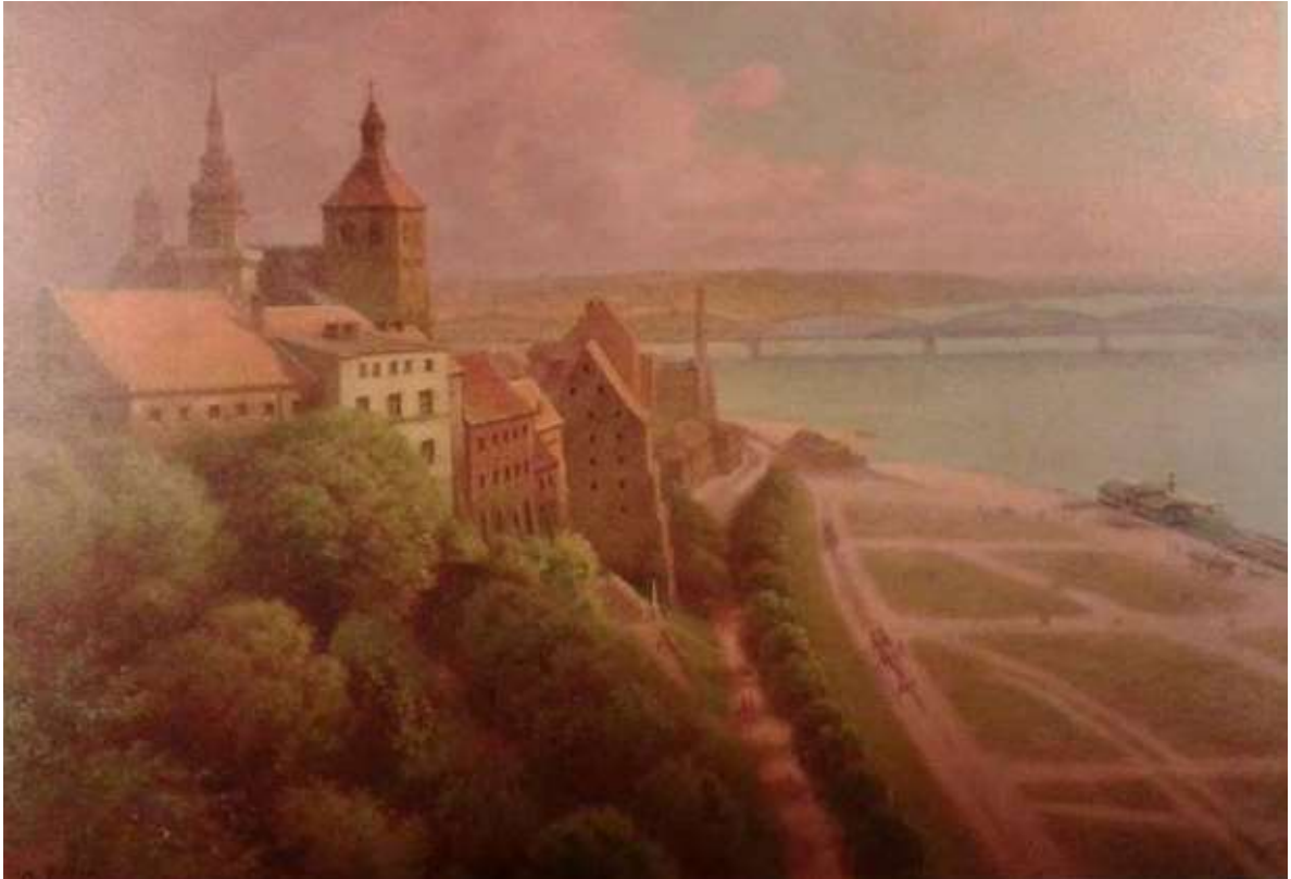
Widok z Góry Zamkowej.