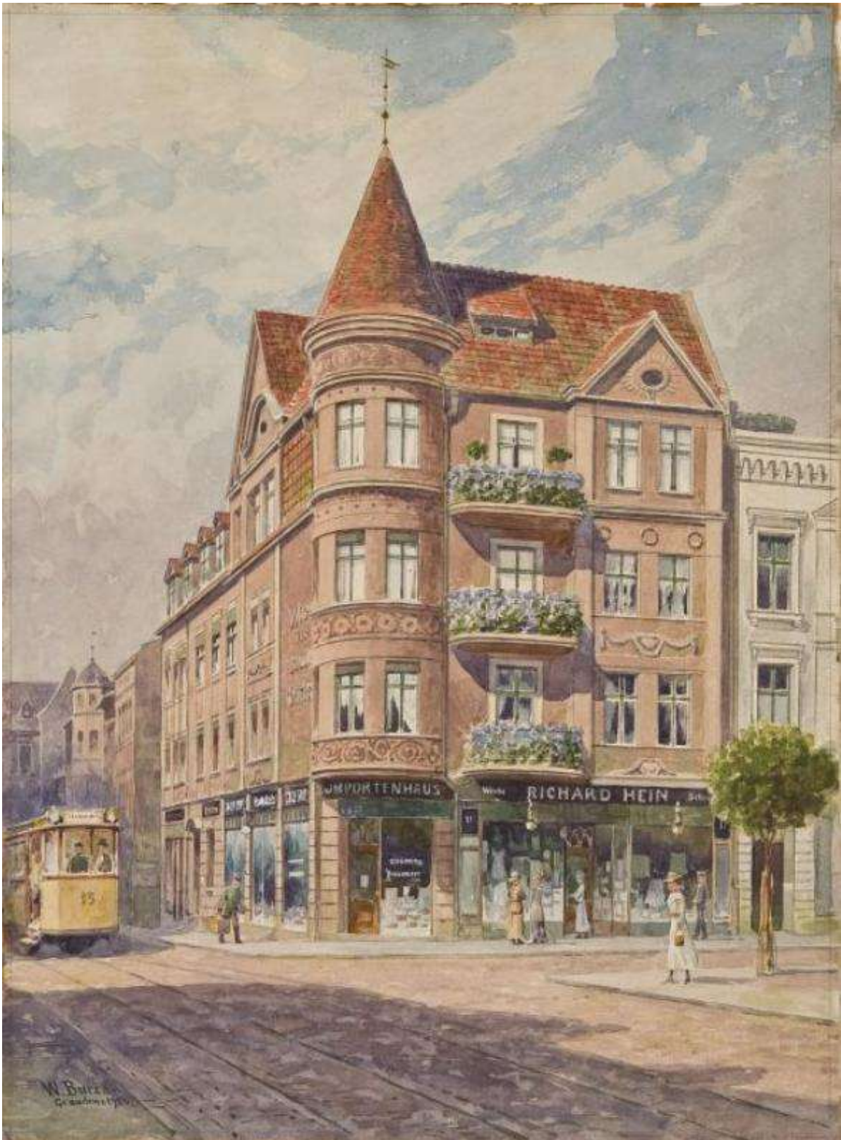
Kamienica narożna przy Rynku w Grudziądzu.