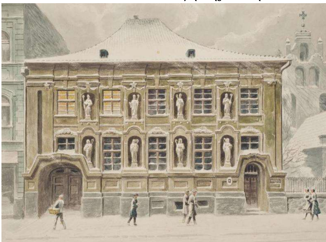
Pałac Opatek w Grudziądzu.