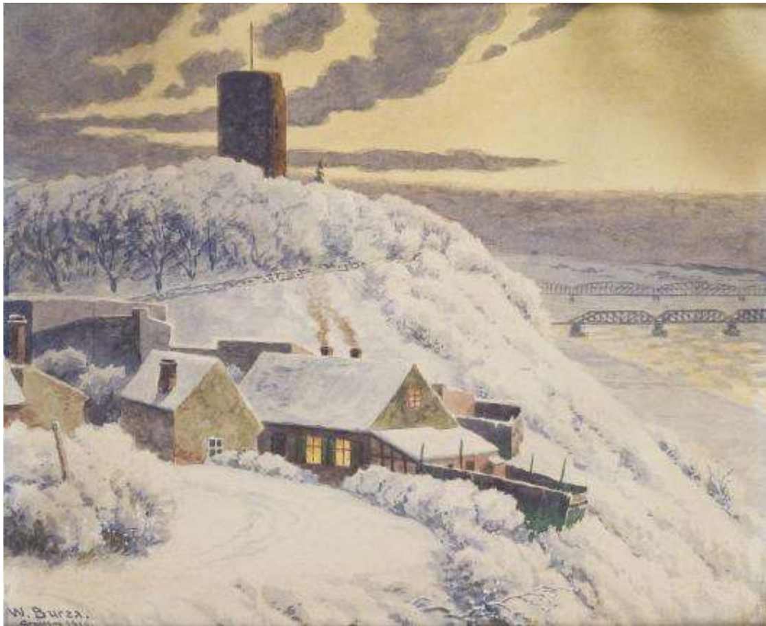
Widok na Górę zamkową i Wisłę.