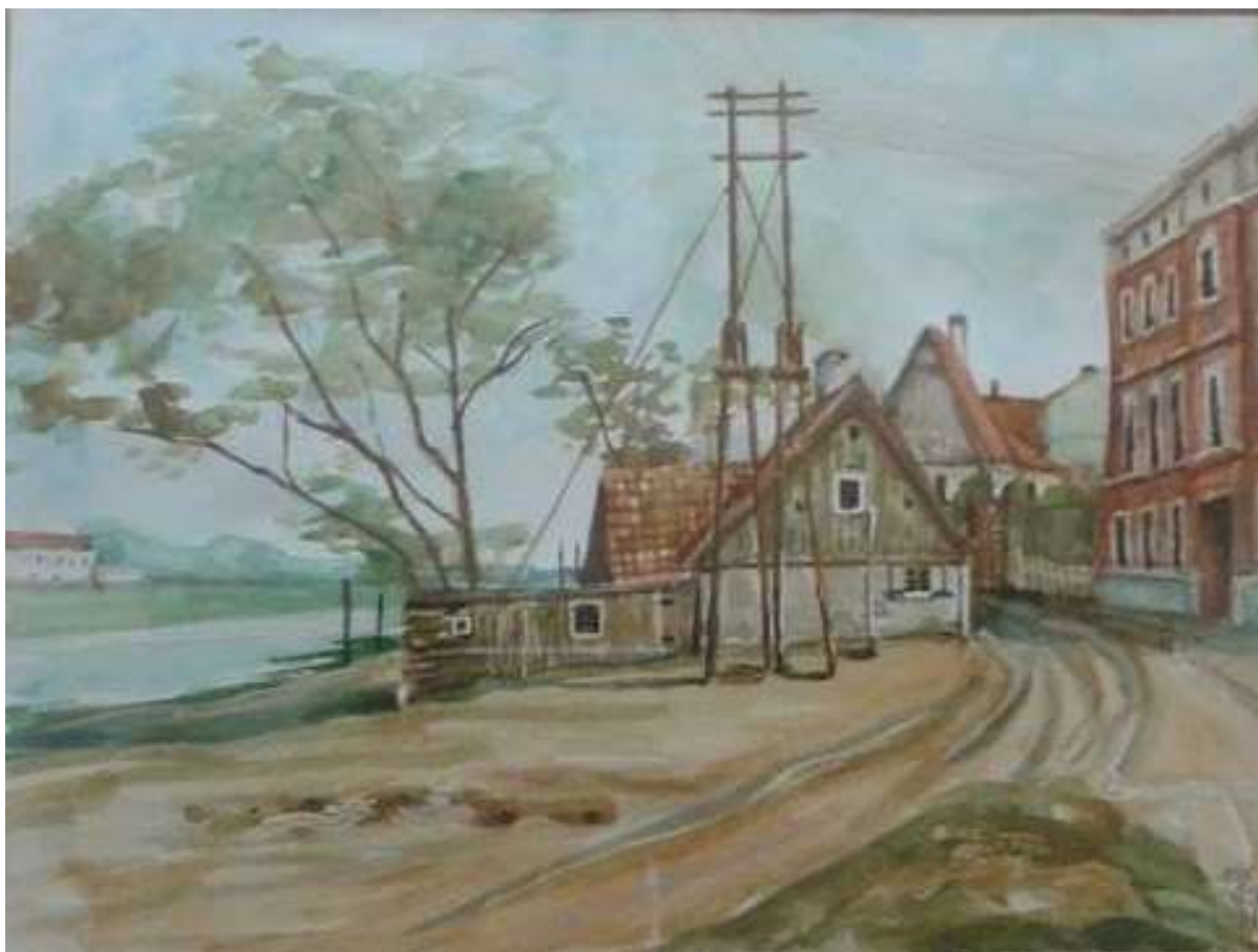
Róg ulicy Rybackiej i Marcinkowskiego (dawna Bracka) w Grudziądz.