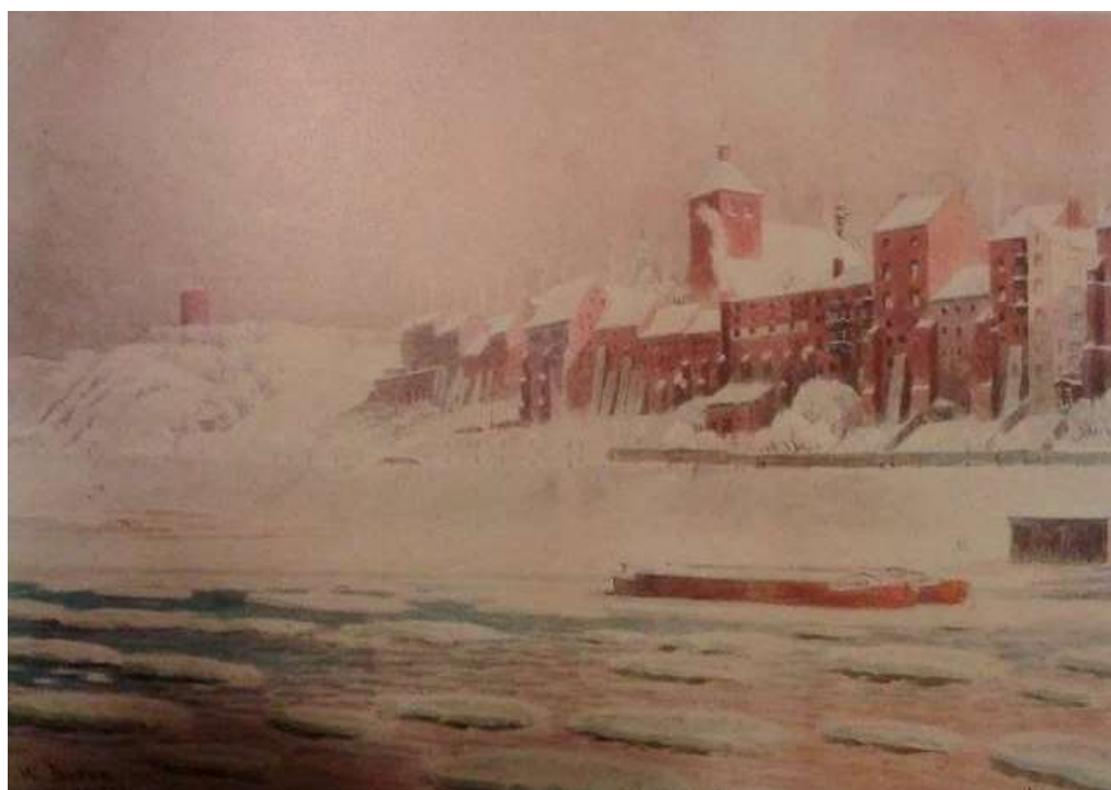
Spichrze w Grudziądz zimą.