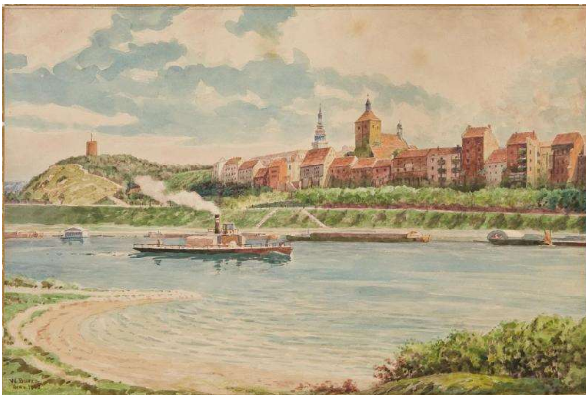
Panorama Grudziądza. Ze zbiorów Muzeum im. ks. dr. Władysława Łęgi.