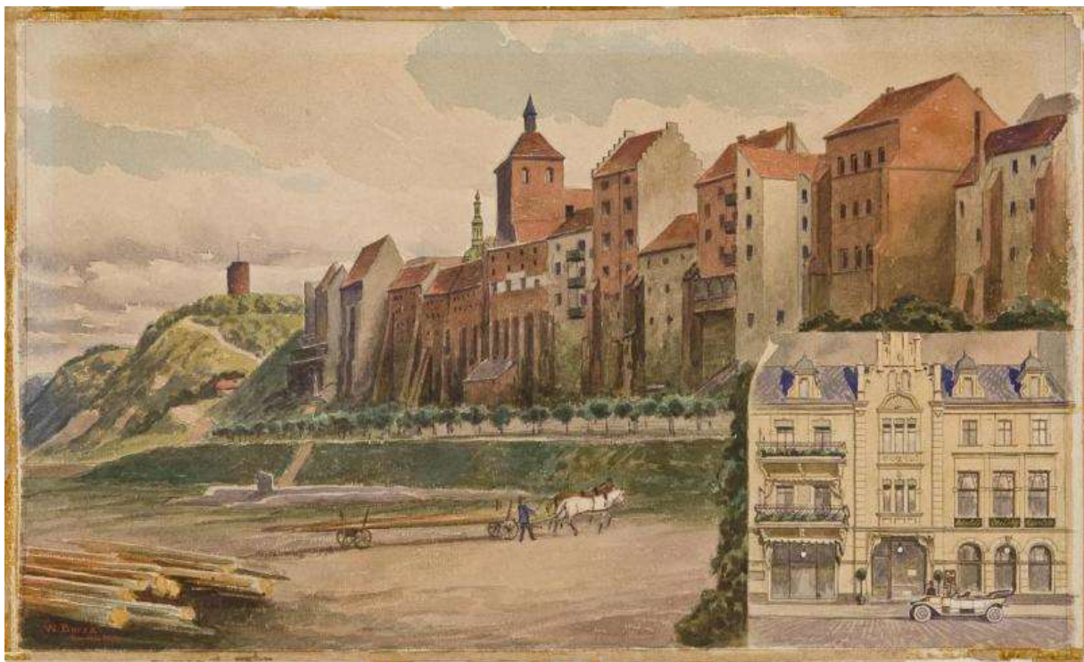
Widok na Spichrze i Górę Zamkową oraz fragment kamienicy przy Getreidemarkt 24, w której mieściła się „Keiser-Kaffe”.