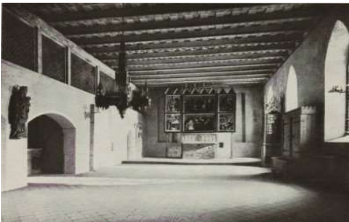
Poliptyk Grudziądzki w kaplicy św. Wawrzyńca w przedwojennym zamku krzyżackim w Malborku