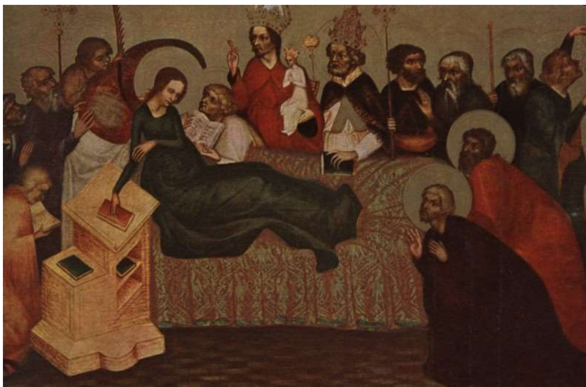
Centralna część ołtarza, kwaterna przedstawiająca Zaśnięcie Panny Marii