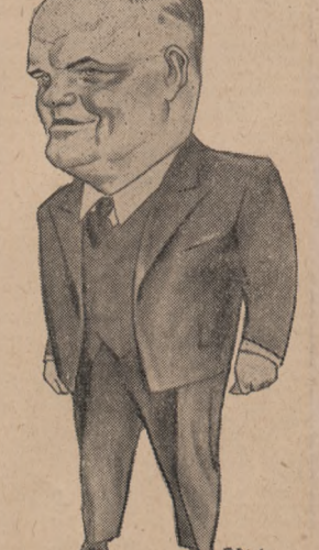
Thorez nie jest juz oddawna wymieniany jako kandydat na premiera. Haslo: „Thorez au pouvoir!” umarlo własna smiercia