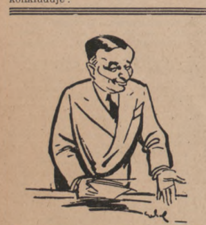
Georges BIDAULT Minister Spraw Zagranicznych, poprzednik i nastepca na tym stanowisku Leona Bluma...