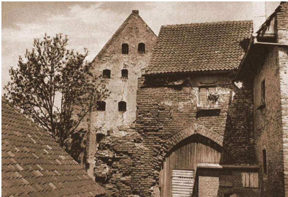
Brama Wodna widok z lat 1918-1939.

rii Grudziądz posiadają konsekwencje w skali ogólnopolskiej? Godzą one w mit o pionierskiej roli Zakonu Krzyżackiego w dziele budownictwa ceglano-głazianego na tym terenie. Niestety Grudziądz na tym traci w tak ważnej dziedzinie, jaką jest oferta turystyczna. Przewodnicy, turyści są pozbawieni pełnego katalogu zabytków Grudziądz. Datacja Bramy Wodnej wg rejestru zabytków pochodzi z lat 30. XX w.