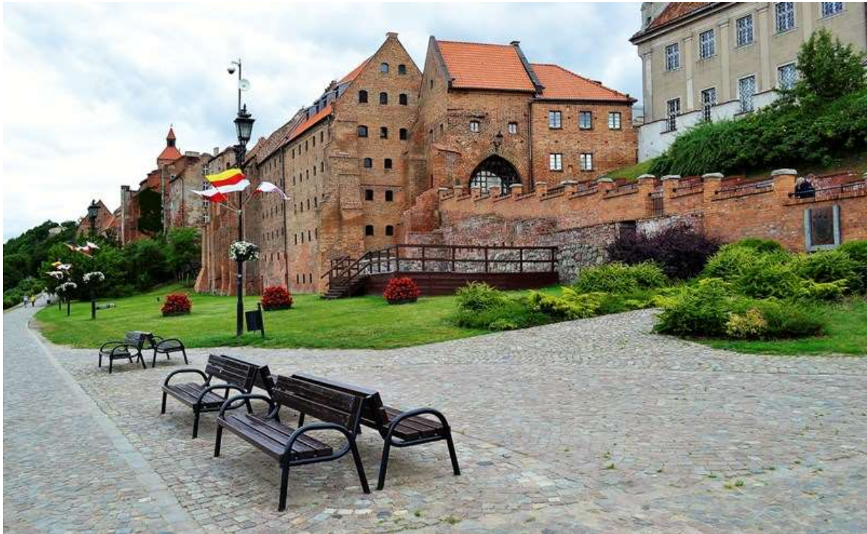
Brama Wodna (widok dzisiejszy).