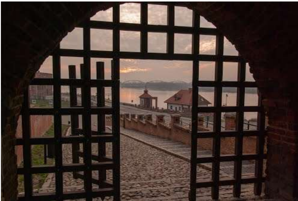
Widok na Wisłę z Bramy Wodnej.