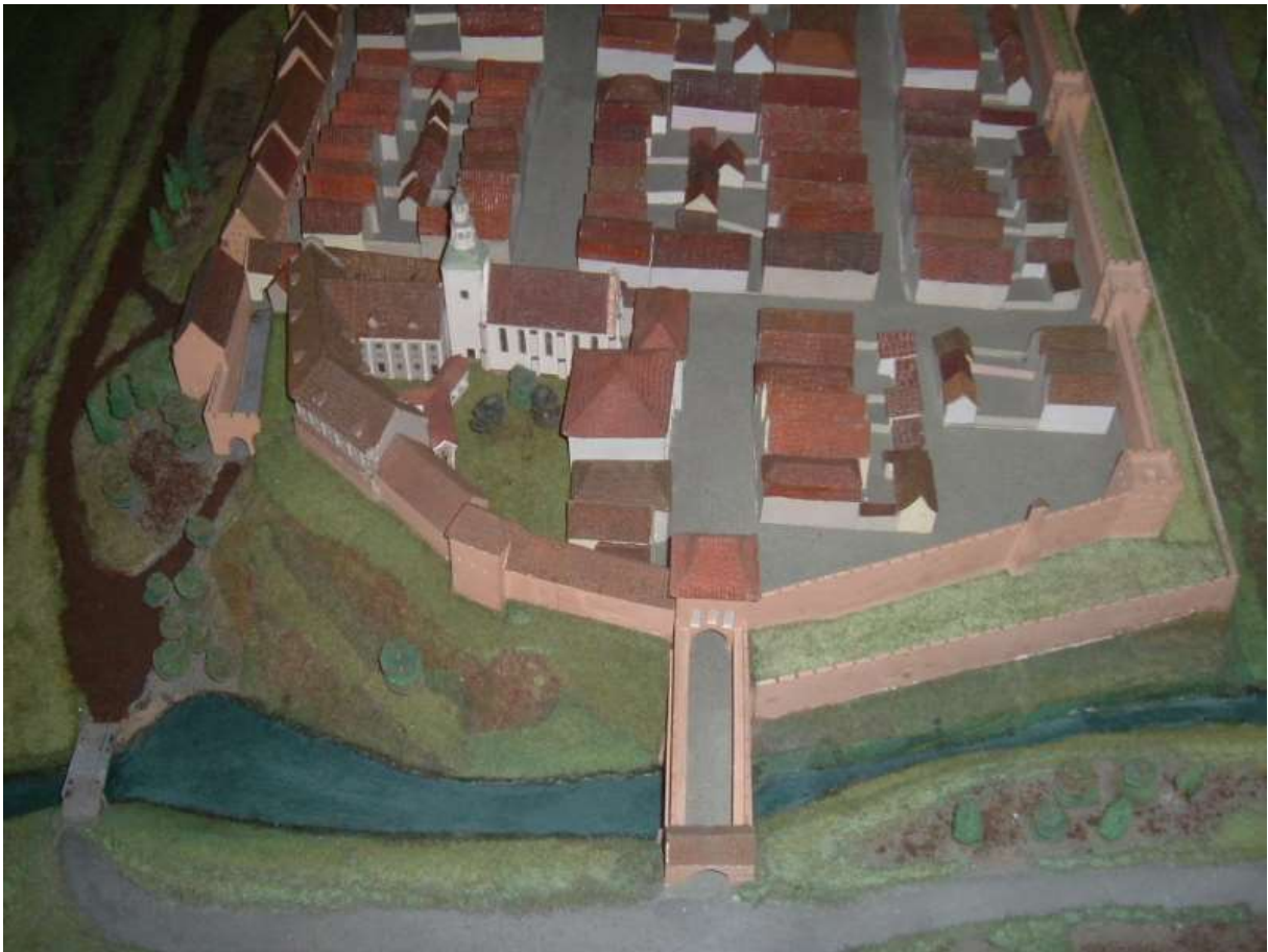
4. Makieta Grudziądzka wg stanu z XVIII w. w Muzeum im. ks. dr. Władysława Łęgi.

Skomplikowaną zabudowę tego obszaru pokazuje też plan rekonstrukcyjny, zawarty w Atlasie Historycznym, z lat 40. XX w., wzorowany na koncepcji C. Steinbrechta, (5) 8 .