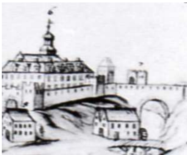
6. Kadr widoku miasta od strony Wisły z rysunku J. F. Steinera, 1 połowa XVIII w.

Brama Wodna posiadała pierwotnie bardziej skomplikowaną strukturę, aniżeli w sposób uproszczony podają to obecne opracowania. W nagromadzonym w tej kwestii materiale historiograficznym, kartograficznym i ikonograficznym powstało wiele zniekształceń i wypaczeń, które należy zweryfikować. Wstępem do podjęcia tego zagadnienia może być analiza kadru panoramy Grudziądza z XVIII w., narysowana przez J. F. Steinera zawierająca ujęcie Bramy Wodnej (6) 19 .