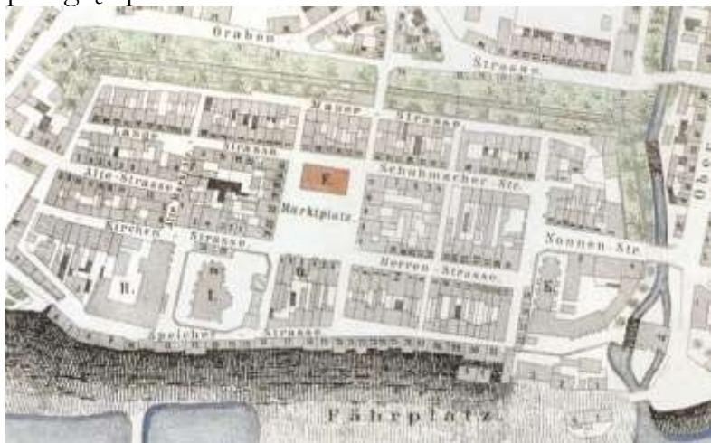
1. Plan katastralny z 1872 r. Kadr z obszarem Grudziądza w obrębie murów obronnych. Całość w Atlas Historyczny Miast Polskich 3 .