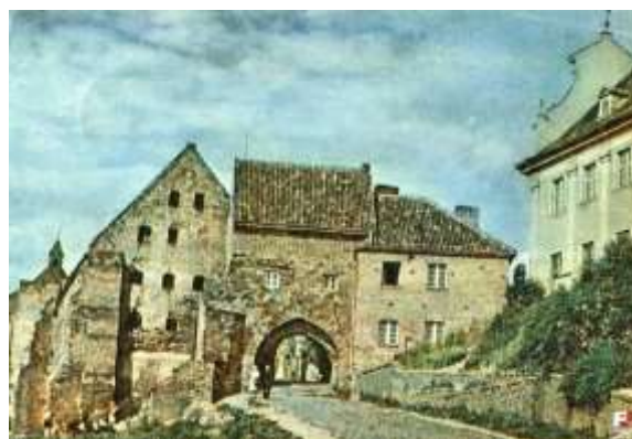
Brama Wodna lata 60. XX w.