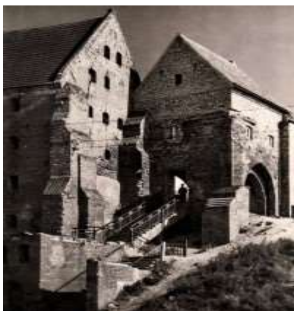
Brama Wodna ze schodami.