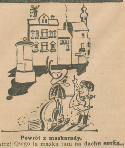
Powrót z maskarady. — Patrz! Czego ta maska tam na dachu szuka..

Dom w Gdyni, 2-piętrowy, okazyjnie do sprzedania, z powodu podziału rodzinnego. Cena 35.000 zł w tem dług B. G. K. 10.000 zł. Wplata 25.000 zł. Dochód miesięczny 360 zł. Zgłoszenia „Gazeta Morska Ilustrow.” Gdynia pod „360”