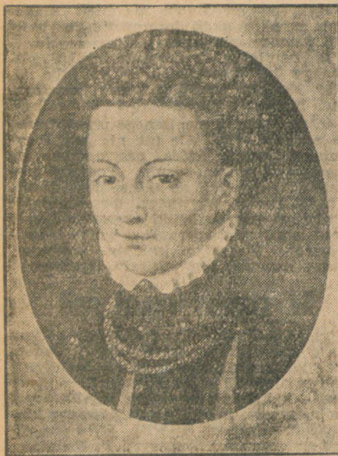
Od śmierci ukochanej królowy Marii Stuart tj. od 8 lutego 1537 r. upływa obecnie 350 lat. Jak wiemy aramat życiowy młodej królowy unieśmiertelnił poeta Schiller