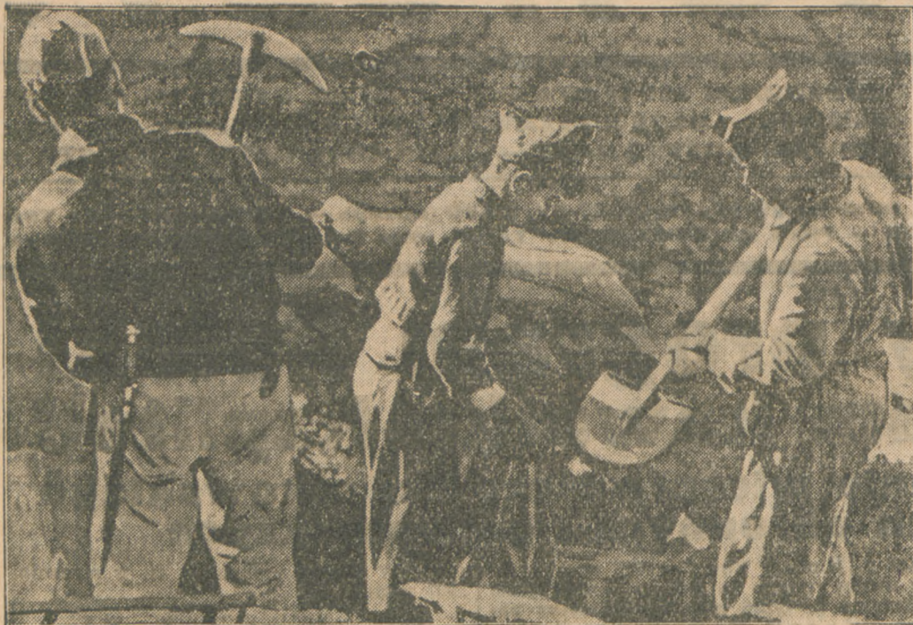
Bolszewicy hiszpańscy z bezwzględną brutalnością zmuszają dzieci do sypania okopów i wznoszenia fortyfikacji w Madrycie

Salamanka, 8. 2. (PAT.) Rozgłoszono powstanie donosi, że na froncie Malagi wojska narodowe zdobyły Fuengirola i dawną siedzibę biskupią Coin pomiędzy Marbella i Malagą.