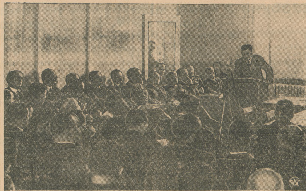
Zdjęcie nasze przedstawia fragment obrad Komisji Budżetowej, podczas przemówienia p. wicepremiera. Na ławach rządowych widoczny p. premier z członkami Rządu.

Program 1937 r. dostosowany do możliwości finansowych Skarbu Państwa prze-