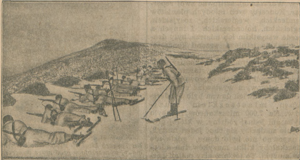
Wojska powstańcze na froncie Grenady toczyć muszą walki wśród śniegów gór Sierra Nevada

Smutne są losy wielkiego i pełnego tradycyjny narodu, który na swej drodze życia zatracił najważniejszy instynkt — i instynkt samozachowawczy.