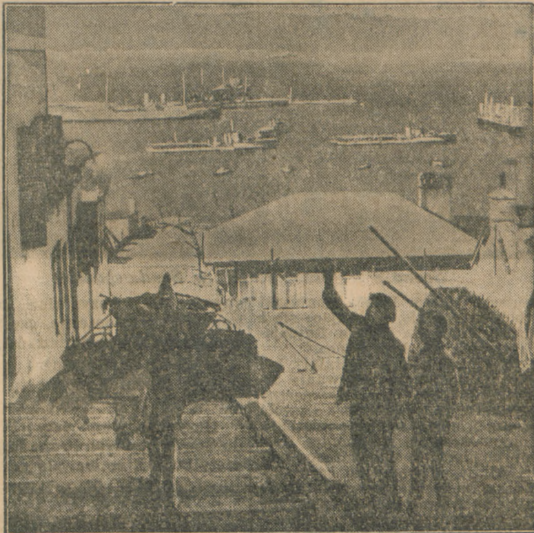
Widok na port w Gibraltarze, skąd wyruszają krążowniki angielskie, mające roztoczyć nadzór nad dojazdem do Hiszpanii

Hiszpania wykrwawia się straszliwie, cywilizacyjnie, demograficznie i finansowo. Na ofiarę molocho wojny rzucone są nie tylko wielkie fortuny grandów i bogaczy hiszpańskich, które dotychczas leżały w ciszy safesów zagranicznych banków, lecz wyprzedawane są bogactwa kraju masowo i bez oglądania się na przyszłość. Miedź, żelazo, rtęć, owoce i oliwa sprzedają się na lat kilka naprzód na pniu. Wszelkie bogactwa kraju topią się w wielkim tyglu nieodpartych potrzeb wojny i bratobójczej waśni.