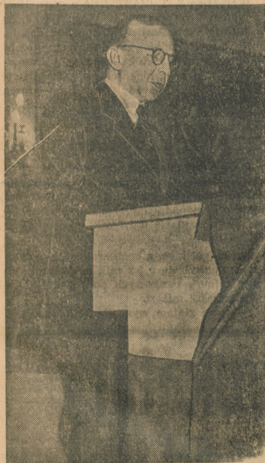
Płk. Adam Koc podczas wygłaszania przemówienia

rodowego dąży do wytworzenia „atmosfery pojednania”, w której — by zacytować słowa Adama Koca, wypowiedziane na zjeździe warszawskim — „wszyscy ludzie dobrej woli i go-