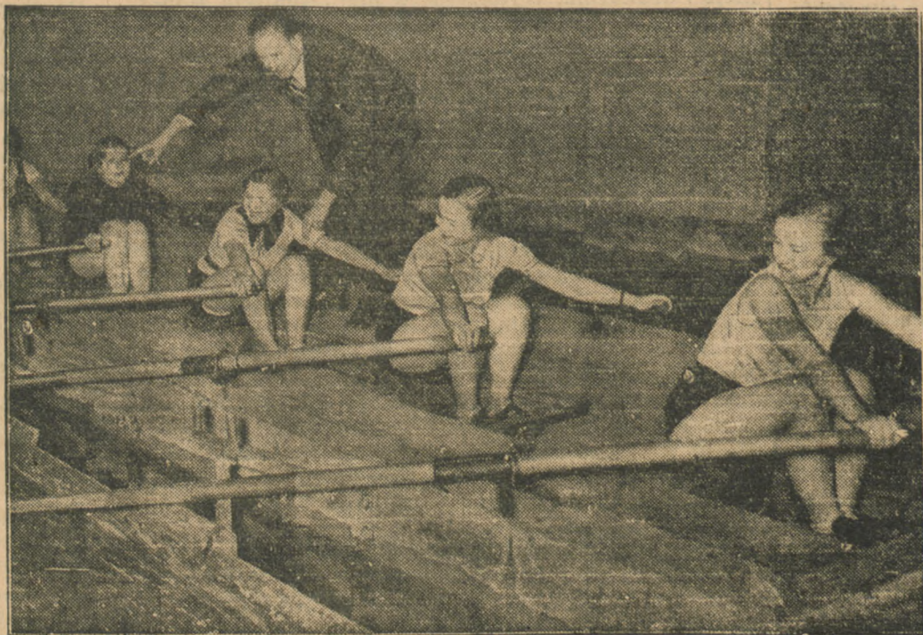
Ostatni suchy trening przed wyjazdem na wodę

Apelujemy i prosimy Pom. Okr. Zw. Piłki Nożnej o zaniechanie dotychczasowej polityki, to jest faworyzowanie siedziby P. O. Z. P. N. Bydgoszczy — i kierowanie się w przyszłości dobrem sportu pomorskiego, przydzielając innym miastom Pomorza rozgrywanie piłkarskich meczów reprezentacji Pomorza, tym bardziej, że o to proszą i ubiegają się pokrzywdzone miasta już od kilku lat.