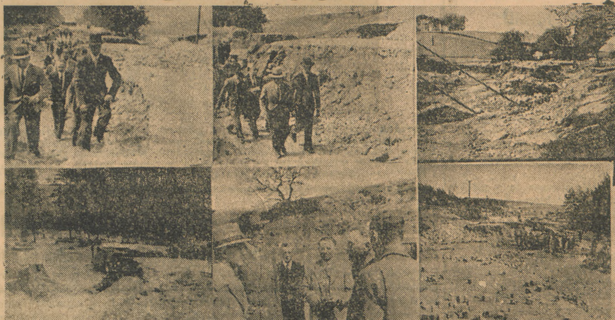
Minister Komunikacji Ulrych i wojewoda Raczkiewicz zwiedzają tereny powodzi na wybrzeżu. Na zdjęciach poza tym rozerwana szosa pod Chwaszczynem i wyrwy pod Kackiem W.

W nocy z dnia 25 na 26 bm. p. wojewoda pomorski Władysław Raczkiewicz powrócił z Warszawy gdzie bawił od poniedziałku 24 bm. Pan Wojewoda w czasie swego pobytu przedstawił osobiście p. prezesowi Rady ministrów generałowi Sławo-