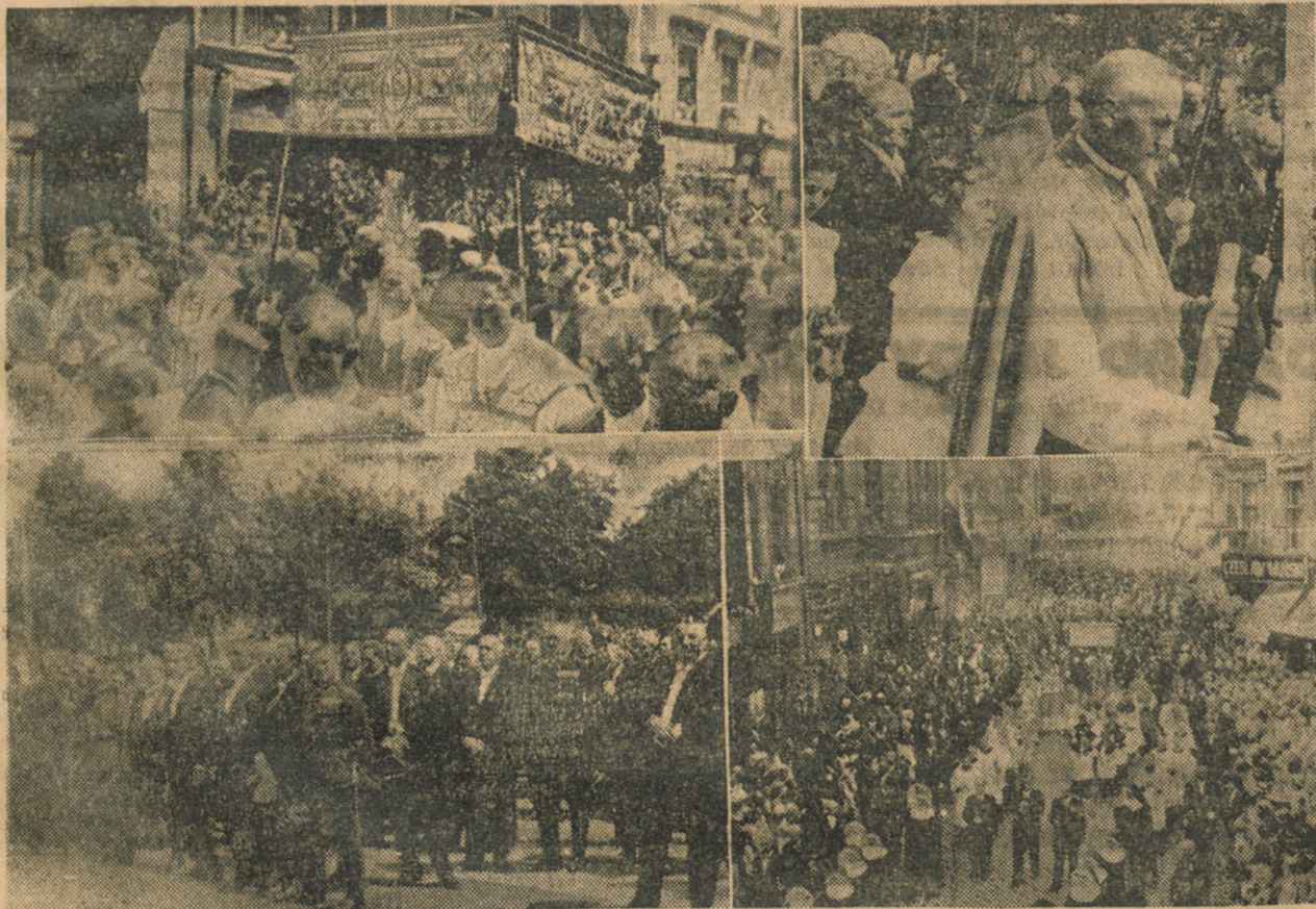
Fragmety wczorajszej procesji

zjalnej, wojska, Sokoła, harcerstwa, cechów rzemieślniczych, sodalicyj, bractw kościelnych z feretronami i chorągwiami, stowarzyszeń sportowych i innych, bractwa kurkowego, które tworzyło szpaler przy balda-