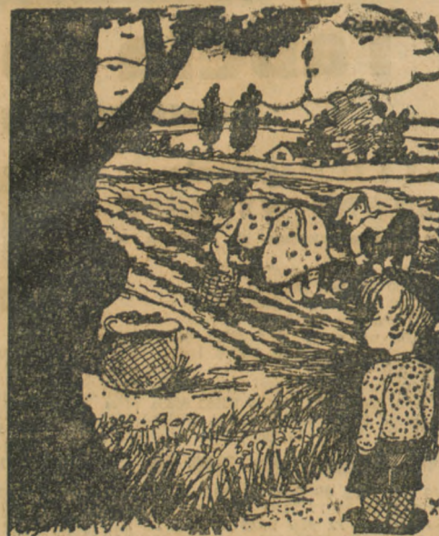
Dziecko z miasta.