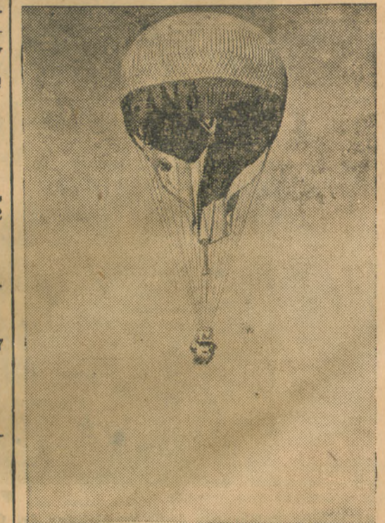
PILOT ZWYCIĘZCA W IX ZAWODACH BALONOWYCH — BĘDZIE BRAŁ UDZIAŁ W TEGOROCZNYCH ZAWODACH „GORDON BENETT”.

c — z Inowrocławia do Poznania i odwrot nie pociągami pospiesznym. d — do Chełmży i odwr. w dni robocze. e — tylko do Wąbrzeźna. f — do Kowalewa i odwr. g — tylko do Kutna. h — przez Skierniewice. z — kursuje od 22. V. — 30. IX codz., od 1 X. w dni robocze. x — w dni robocze.