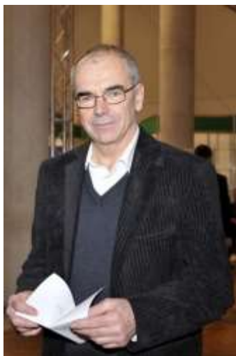
Sławomir Idziak – operator – zdjęcia

Sławomir Andrzej Idziak (ur. 25 stycznia 1945 r. w Katowicach) – polski operator filmowy, reżyser, scenarzysta filmowy. W ukończył studia na Wydziale Operatorskim Państwowej Wyższej Szkoły Filmowej, Telewizyjnej i Teatralnej w Łodzi. Współpracował z polskimi filmowcami takimi jak Krzysztof Kieślowski, Jerzy Kawalerowicz, Andrzej Wajda czy Krzysztof Zanussi. W latach 90. XX w. zaczął pracować w Stanach Zjednoczonych. Członek Polskiej Akademii Filmowej. W 2002 był nominowany do Nagrody Akademii Filmowej za zdjęcia do filmu Helikopter w ogniu . Nagradzany m.in. na festiwalu Camerimage – w 2004 r. otrzymał nagrodę specjalną za wybitne osiągnięcia w sztuce operatorskiej, a w 2013 r. nagrodę za całokształt twórczości. W 2002 r. wyróżniony nagrodą specjalną na ceremonii rozdania „Orłów”. Nagradzany również na Festiwalu Polskich Filmów Fabularnych.