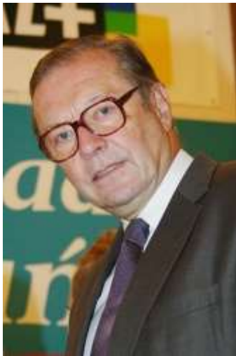
Krzysztof Zanussi jako reżyser i scenarzysta tego filmu.

Krzysztof Zanussi (ur. 17 czerwca 1939 w Warszawie) – polski reżyser i scenarzysta filmowy, teatralny i telewizyjny, producent filmowy, publicysta, pedagog oraz filozof. Urodził się w rodzinie inteligenckiej włoskiego pochodzenia. Studiował fizykę na Uniwersytecie Warszawskim i filozofię na Uniwersytecie Jagiellońskim. Równocześnie działał w amatorskim ruchu filmowym. W latach 1962-1966 studiował na Wydziale Reżyserii Szkoły Filmowej w Łodzi. Od 1980 r. jest kierownikiem artystycznym zespołu, a następnie dyrektorem Studia Filmowego „Tor”. Jest autorem kilku książek (teoria filmu, scenariusze filmowe, felietony, wspomnienia. Jest wykładowcą w wielu uczelniach. Jest także honorowym przewodniczącym włoskiego festiwalu Popoli e Religioni – Terni Film Festival oraz propagatorem założenia sieci inter-religijnych festiwali europejskich, Osobie i twórczości Krzysztofa Zanussiego poświęcono dwa filmy dokumentalne.