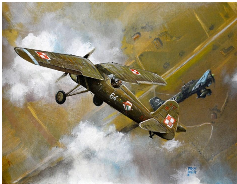
Przebieg bitwy powietrznej

PZL P.11 – polski samolot myśliwski konstrukcji inżyniera Zygmunta Puławskiego z okresu przed II wojną światową. Produkowany w Polsce w zakładach PZL w latach 1934–1936, a także na licencji w zakładach IAR w Rumunii. Stanowił jednomiejscowy górnopłat konstrukcji metalowej, z odkrytą kabiną i stałym podwoziem, napędzany silnikiem gwiazdowym. W chwili wejścia do służby w 1935 roku należał do światowej czołówki pod względem nowoczesności, lecz w 1939 roku ustępował już znacznie osiągamami nowym samolotom niemieckim. Mimo to, w najliczniejszej wersji P.11c był podstawowym polskim myśliwcem podczas wojny obronnej w 1939 roku. Zwany potocznie „jedenastką”, uznawany jest za symbol polskiego lotnictwa wojskowego okresu kampanii wrześniowej[1]. Myśliwców P.11a i P.11c używało 12 eskadr myśliwskich z 15 posiadanych, wchodzących w skład Brygady Pościgowej oraz lotnictwa armijnego. Używany ponadto bojowo na froncie wschodnim II wojny światowej przez lotnictwo Rumunii, które przejęło również część polskich samolotów. Wyprodukowano ogółem 350 samolotów, w tym 200 seryjnych dla lotnictwa polskiego i 145 dla rumuńskiego.