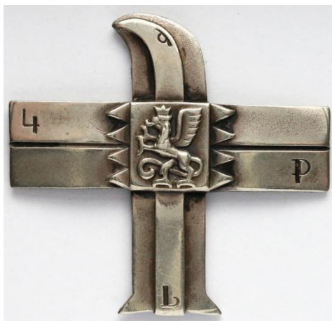
Odznaka pamiątkowa 4 Pułku Lotniczego.

141 Eskadra wchodziła w skład III Dywizjonu Myśliwskiego 4 Pułku Lotniczego w Toruniu. W kampanii wrześniowej 1939 r. walczyła w składzie lotnictwa Armii "Pomorze" (1-6 IX), a następnie Brygady Pościgowej. 31 sierpnia перебазowana została na lotnisko polowe w pobliżu wsi Markowo. Na uzbrojeniu znajdowało się dziesięć samolotów PZL P.11c.