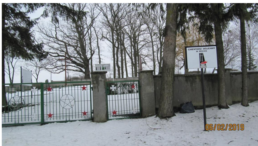
Cmentarz wojenny w Melnie.