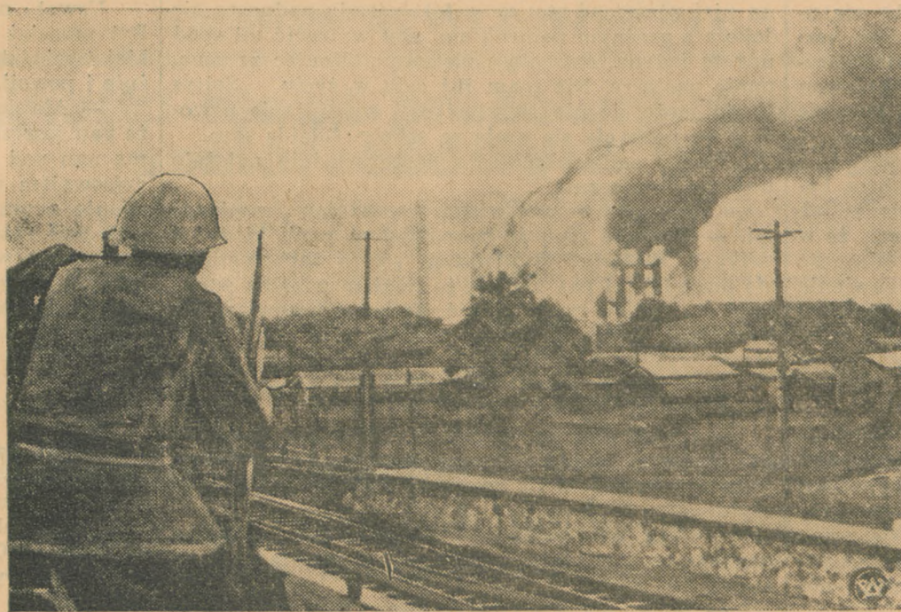
Reprodukowane przez nas zdjęcie przedstawia wielkie młyny zbożowe w pobliżu Tientsinu, które zostały zbombardowane przez japońskie samoloty. — Zdjęcie, które zostało zrobione w parę chwil po zbombardowaniu, przedstawia palące się młyny chińskie.