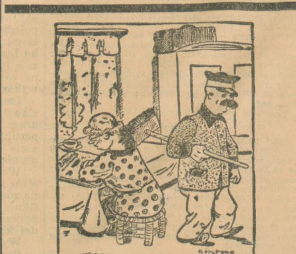
— Wiktorze, czemuś tak czuły dziś do mnie? Przecież ucałowałeś mnie już dziś raz jeden.

Km. 1072/37. 5787 OBWIESZCZENIE Komornik Sądu Grodzkiego w Grudziądzu rewiru I. Stanisław Lewicki, zamieszkały w Grudziądzu przy ul. Budkiewicza 9 na zasadzie art. 602 k. p. c. ogłasza, że w dniu 10 września 1937 r. o godz. 13.30 w Świeciu odbędzie się publiczna licytacja nieruchomości, a mianowicie: 147 ctn. żyta niemieckiego, oszacowanych na łączną kwotę 1.617,— zł. Powyższe nieruchomości oglądać można w dniu licytacji w miejscu sprzedaży w czasie wyżej oznaczonym. Grudziądz, dnia 23 sierpnia 1937 r. (—) Lewicki, komornik Sądu Grodzkiego.