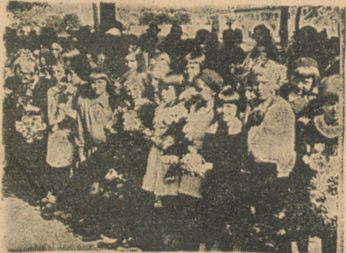
Dziatwa szkolna z naręczami kwiatów oczekuje na żołnierzy...

Serce Torunia bije mocniej, goręcej niż zwykle. Dla całej armii i dla każdego żołnierza z osobna. Żołnierz w dniach tych staje się wcieleniem symbolu ka-