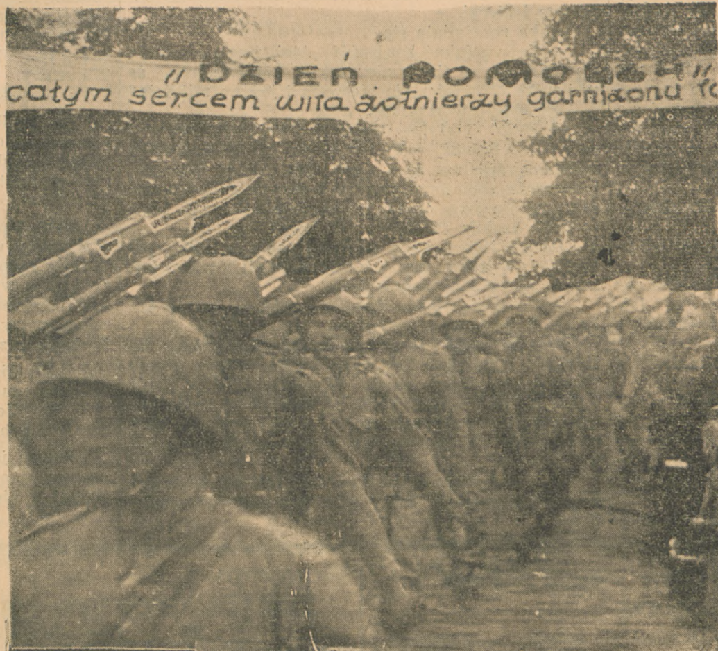
Pułk „Dzieci toruńskich” dziarsko defiluje na ulicach Torunia po uciążliwych manewrach.

Na cześć Waszą powiewają flagi, wznoszą się okrzyki, tak szczerze, jak Wasza wierna służba, dla Ojczyzny.