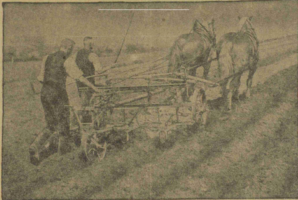
Uprawa ziemi odbywa się podobnie jak w „starym kraju”

lewała się wówczas szeroko po terenach, uprawianych przez polskich osadników. Gdy woda stała zbyt długo, nasiona w ziemi gnily, gdy natomiast zbyt szybko odchodziła, zabierała ze sobą wierzchnią warstwę ziemi a z nią cenne nasiona. Po odejściu wód na łustej ziemi, pokrytej warstwą ilu rzeczno, wyrastały bujne chwasty, które zagłuszały rośliny. Od wczesnego rana do późnej nocy wyrzynano je gołymi rękami, kłęcząc na mokrej ziemi.