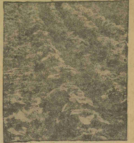
Ręka polska wyhodowane warzywo na glebie amerykańskiej

Rok 1941 dla polskich osadników był rokiem wielkiej klęski żywiołowej. Burze piaskowe powyrwały rosnące w ziemi cebule, a nasiona rozniosły po okolicznych wzgórzach. Zebrano wówczas zaledwie trzecią część normalnego plonu. Burze wyrządziły tak olbrzymie szkody, że ludzie zaczęli z troską patrzeć w przyszłość. Nie załamali