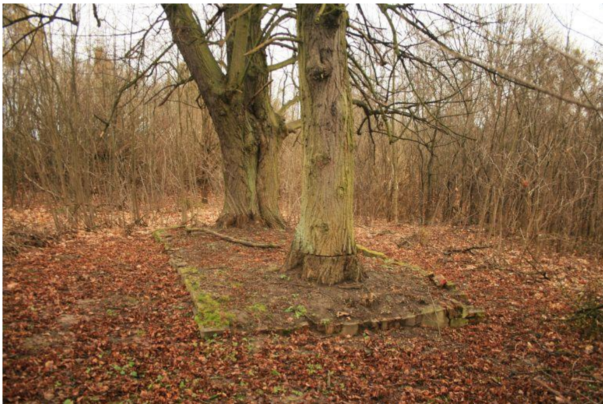
Miejsce dawnego grobu Corbière'a

W 1815 roku król Fryderyk Wilhelm III polecił ustawić na placu ćwiczeń pomnik ku czci Courbière. Monument zaprojektował najwybitniejszy architekt niemiecki tego czasu Karl Friedrich Schinkel. Forma naśladowała starożytny tropaion (trofeum) – pomnik zwycięstwa. Na kamiennym cokole na podstawie z moździerzy artyleryjskich i nad orłami podtrzymującymi pamiątkową inskrypcję, umieszczono płonące granaty. Nad nimi ustawiono zwinięte sztandary, tworzące ażurowy kształt obelisku. Strukturę wieńczył wieniec laurowy i pruski orzeł.