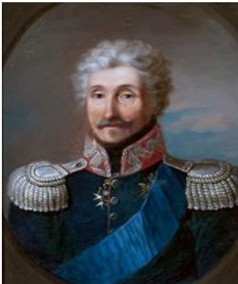
Gen. Józef Zajączek

Aby wzmocnić siły oblegające, Napoleon skierował pod Grudziądz 7 i 8 pułki piechoty z Legii Kaliskiej, którymi dowodził generał dywizji Józef Zajączek.