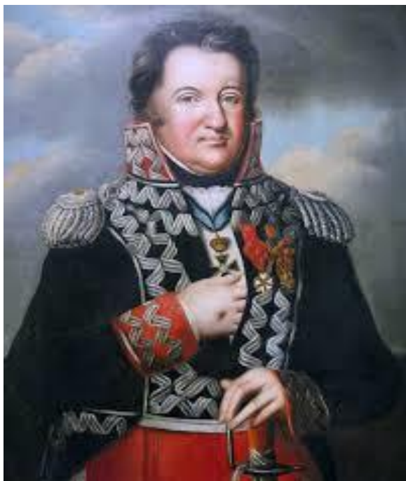
Jan Henryk Dąbrowski