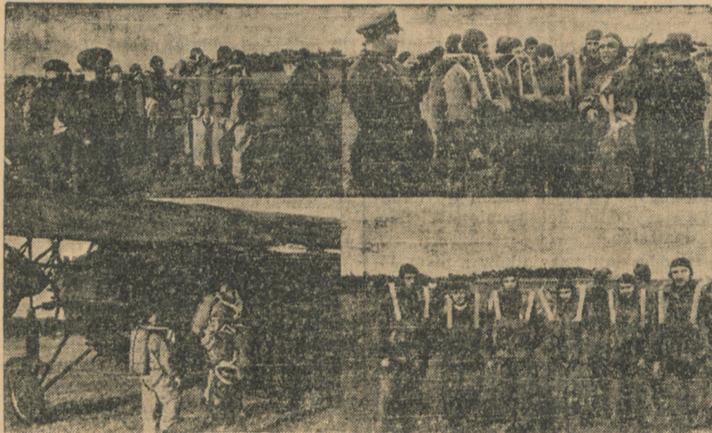
Reprodukcja fotomontaż z końcowego etapu kursu spadochronowego, zorganizowanego przez Dęblińskie Koło LOPP. Nr. 10 w Dęblinie. — Zdjęcia nasze przedstawiają: u góry na lewo — zrywanie bomb ze spadochronów przed skokiem, na prawo — przygotowanie skoczków do skoków; u dołu na lewo — moment wejścia do samolotu celem wyszkolenia skoków, zaś na prawo — najlepszy zespół skoczków Dęblińskiego Koła LOPP.