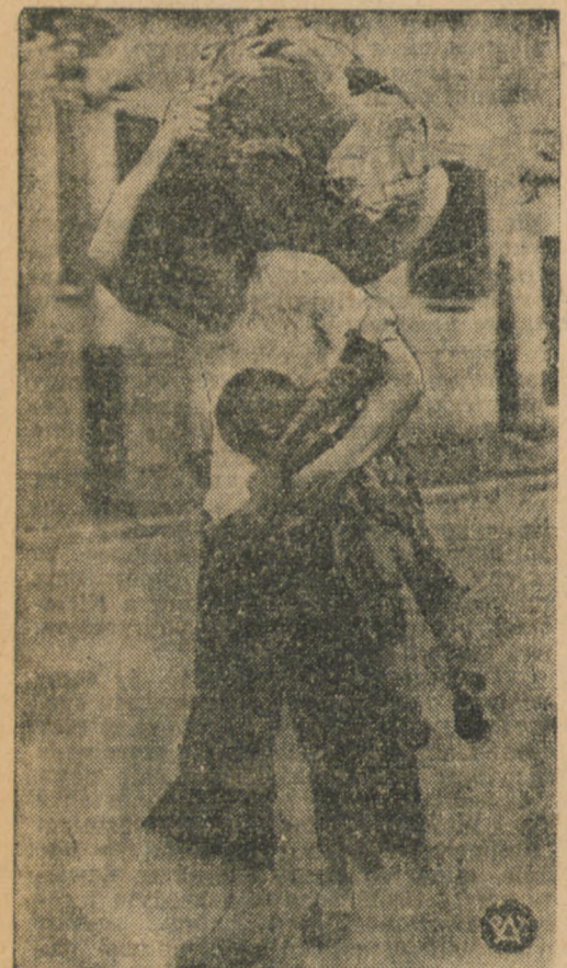
Niezwykle wymowna scena z swakucej bombardowanych przez Japończyków miast chińskich; kobieta chińska z dzieckiem i z alym swym dobytkiem, ratująca się ucieczką z Szanghaju.