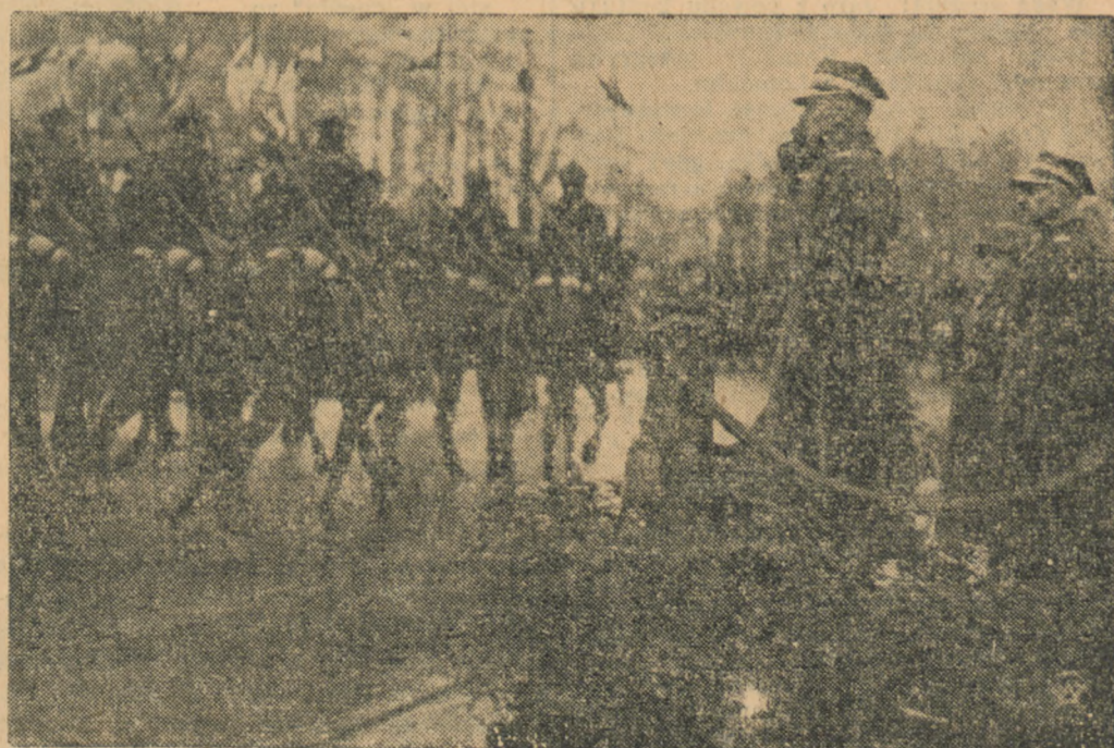
Kawaleria defiluje przed Naczelnym Wodzem Marsz. Smielcem - Rydmanem.