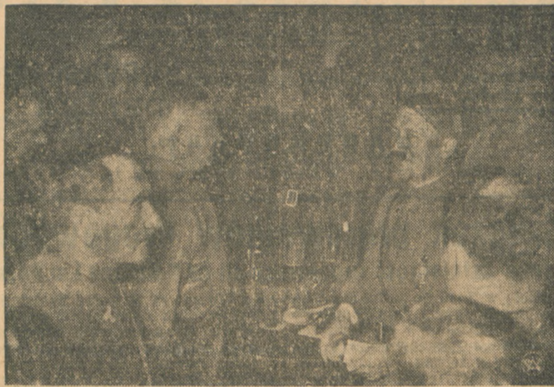
Zdjęcie nasze przedstawia kancelarza Rzeszy Niemieckiej Adolfa Hitlera w otoczeniu najstarszych bojowników partii narodowo-socjalistycznej, podczas uroczystego apelu, który odbył się w Monachium w historycznej pierwszej kwaterze partyjnej (w piwnicy starej mieszczańskie gospody).