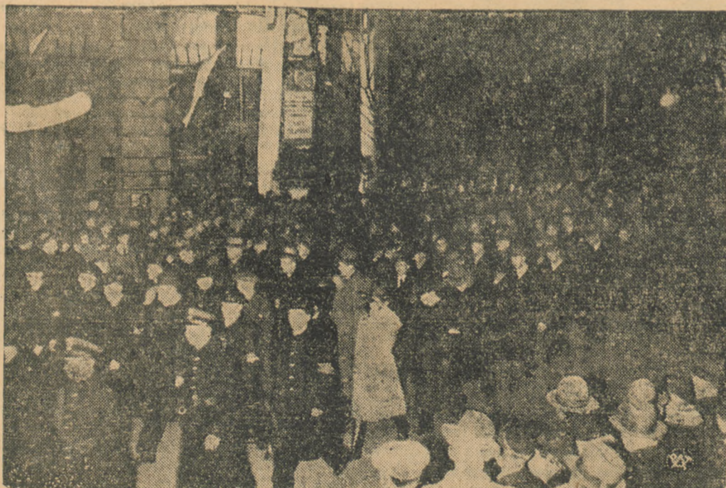
Wieczerny pochód tłumów do Belwederu w przeddzień święta Niepodległości.