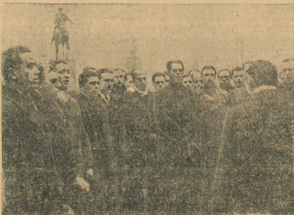
Zdjęcie nasze przedstawia moment odśpiewania przez chór bułgarski „Gusla” przed grobem Nieznanego Żołnierza w Warszawie pieśni „Wieczna pamięć”.