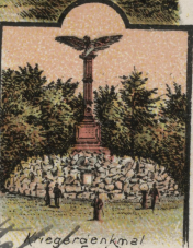
Kriegsdenkmal an der Festung.