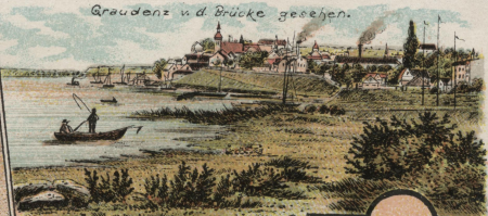
Graudenz u. d. Brücke gesehen.