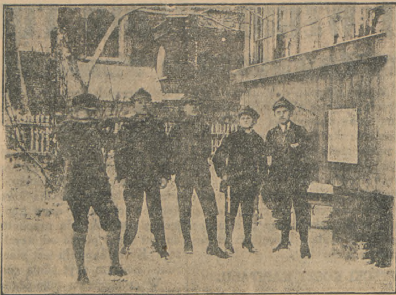
Najmłodsi podczas strzelania z broni małokalibrowej.

Hasłem naszym na Święto Młodzieży: „Wszystko dla młodzieży, albowiem jest ona do wyższych rzeczy stworzona”.