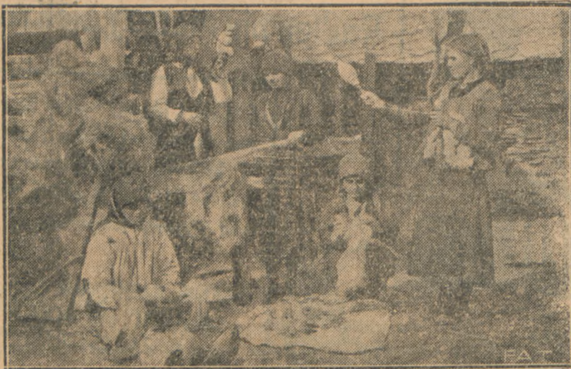
Na ilustracji naszej widzimy charakterystyczny obrazek ze wsi bułgarskiej. Przed chatą włościańską stoi kilka kobiet w strojach ludowych zajętych przedmiotem.