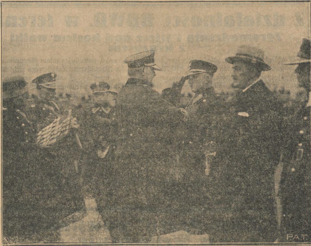
Korpus policji państwowej obchodził w stolicy uroczyste wigiliję swego dorocznego święta, przypadającego na dzień 11 listopada. Główny komendant PP, płk. Maleszewski dekoruje policjantów, odznaczonych Krzyżem Zasługi za dzielność.