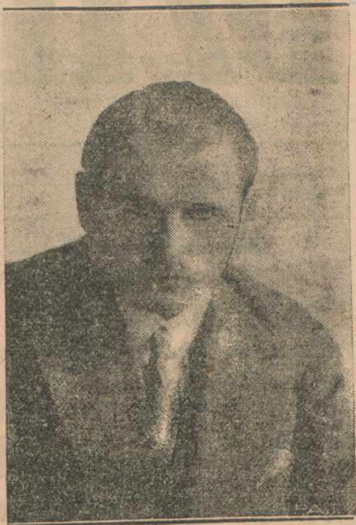
Pan Prezydent RP. dekretem z 17 grudnia r. b. powołał podsekretarza stanu w Ministerstwie Skarbu p. Stefana Starzyńskiego na stanowisko wiceprezesa Banku Gospodarstwa Krajowego. P. wiceminister Starzyński objął swoje nowe obowiązki w BGK w dniu 21 grudnia r. b. — Na zdjęciu naszym podajemy podobiznę p. Stefana Starzyńskiego.