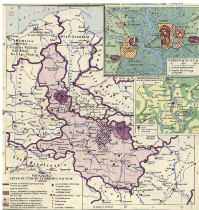
Ryc. 6. Mapa posiadłości arcybiskupów gnieźnieńskich w XII w. Wg Atlasu Historycznego Polski .

Kwestia widel Osy posiada kluczowe znaczenie dla prawidłowego odczytania przywileju lokacyjnego Grudziądza. Wielu badaczy bagatelizuje ten problem. Przykładem jest mapa z Atlasu Historycznego Polski 11 , (ryc. 6).