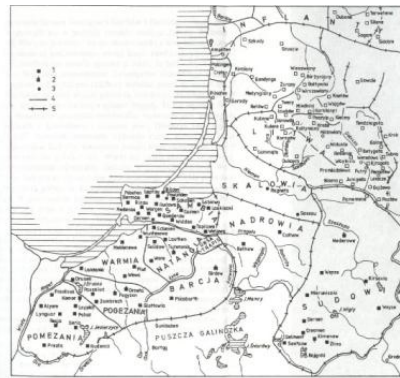
Ryc. 144. Przewidywany obszar podboju krzyżackiego w okolicach M. Łowickiego (1982). 1 – obszary ziem polskich, 2 – dotychczasowe ziemie ziem polskich, 3 – linia niepowodzenia, 4 – sytuacja granic, 5 – granice w starszych państwach.