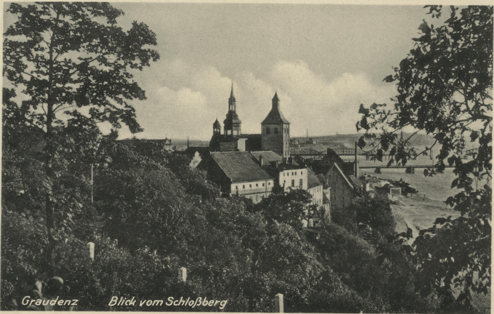
Graudenz Blick vom Schloßberg