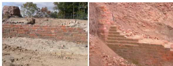
Ryc. 64. Rynsztok w części północnej zamku wysokiego. Przykład zastosowania wątku wedyjskiego. Stan w 2009 r.