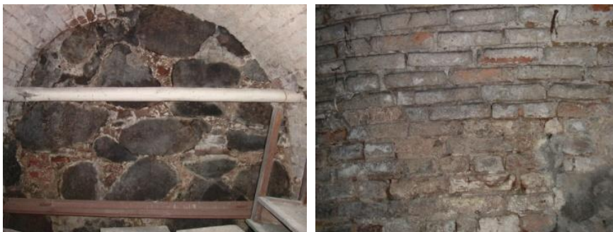
Ryc. 69. Obecne piwnice przy ul. Kościelnej 10, dawniej teren stajni.

Obecny natomiast rynek w środku miasta zajmowała szkoła kolegiacka. Dopiero w 1584 r. ten plac został zapewne przejęty przez miasto i można było tam urządzić ratusz. Jeszcze na planie katastralnym z przełomu XVII/XVIII w. przy rynku oznaczono posesje, jako dzierżawy od klasztoru (cenobium) 6 .