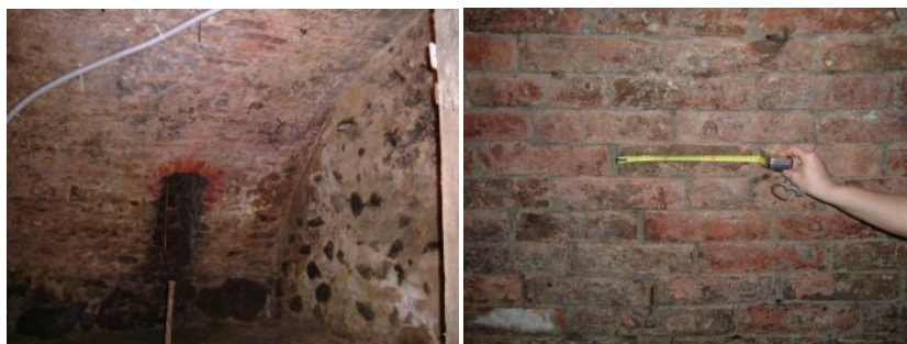
Ryc. 76. Piwnica kamienicy przy ul. Kościelnej 31. W średniowieczu zapewne był to teren przedzamcza. Stan z l. ok. 2000- 2009 r.

Dla badań nad zamkiem wysokim ważna może być też kamienica przy ul. Kościelnej 31, (ryc. 76-79). Zapewne do poszerzenia własności miejskiej lub dzierżawy, dokonanej przez Zakon na rzecz mieszczan w l. 1320-1328, ta posesja wchodziła w skład przedzamcza. Był tu do 2017 r. mur z blendami, który mógł być murem kurtynowym przedzamcza.