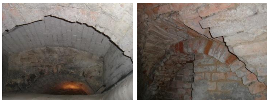
Ryc. 71. Obecne piwnice przy ul. Kościelnej 10, dawniej teren stajni.