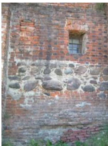
Ryc. 68. Spichrz nad Wisłą. Przykład występowania wiązania krzyżowego pod wiązaniem gotyckim. Teoretycznie warstwy niższe powinny być starsze. Ten fragment ściany jest przypuszczalnie unikatowym w Grudziądzu wzorem zdobienia muru gotyckiego zendrówkami. W przypadku kościoła św. Mikołaja z zendrówek utworzono romby.

Na temat wiązań cegieł w Grudziądzu napisałem artykuł w Biuletynie Koła Miłośników Dziejów Grudziądza w 2014 r. 4