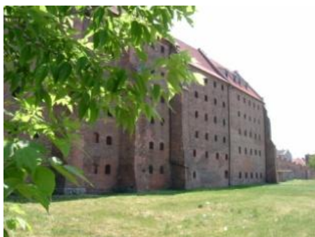
Rys. 62. Spichrze krzyżackie, sprzed 1345 r. Fot. M. Szajerka.

Ryc. 61. Przykład zapewne łuku portalu jednej z furt. Fot. M. Szajerka.