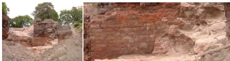
Ryc. 66. Zamek wysoki, skrzydło południowe ukończone przed 1299 r. Przykład zastosowania wiązania krzyżowego. Stan w 2009 r.