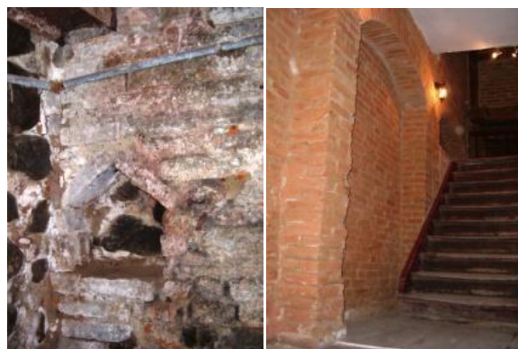
Ryc. 78. Piwnica kamienicy przy ul. Kościelnej 31. Wnęka oświetleniowa.