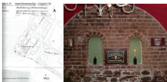
Ryc. 74. Plan miasta z 1881 r. Za: W. Sieradzanem 8

Zapewne kanonicy chełmińscy mieli w posiadaniu środkowe kwartały miasta spichrzowego, na których był kościół św. Mikołaja z rezydencją kanoników, kompleks szkoły kolegiackiej na obecnym Rynku oraz liczne budynki gospodarcze. Na załączonym planie, filetowym prostokątem zaznaczono przybliżony obszar własności kanoników. Na tym planie nie zaznaczono części zachodniej przedzamcza południowego z kościołem, też zapewne należącego do Kościoła. Ten plan z 1881 r. odzwierciedla zapewne jeszcze stan fortyfikacji ze średniowiecza i czasów nowożytnych (ryc. 74). Pokazuje, że spichrze nadwiślańskie w części południowej, rozgraniczone Bramą Gnojną od spichrzy kościelnych, także posiadały na skrzydłach baszty. Ta linia spichrzy od strony Wisły uległa zatarciu w następstwie przebudów w 2 poł. XIX w. i w XX w. Tylko spichrze „kościelne” zachowały ten charakterystyczny element baszt-spichrzy na skrzydłach.