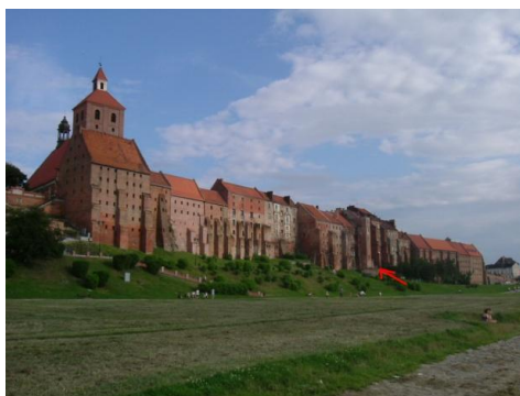
Ryc. 63. Spichrze nadwiślańskie. Strzałką zaznaczono lokalizację Bramy Gnojnej. Obecnie jest to plomba budowlana z 1 poł. XX w.

Spichrze kościelne od krzyżackich, (ryc. 62-63) rozdzielala zapewne Brama Gnojna. Lokalizacja Bramy Gnojnej pokrywa się z różnicami architektonicznymi między spichrzami w częściach południowej i północnej. Można też przyjąć, że obiekty przy obecnej Spichrzowej 37-47 należały do Krzyżaków i pełniły funkcję stajni dla koni pocztowych. Udokumentowane źródłowo stajnie kościelne były przy obecnej ulicy Kościelnej 10.