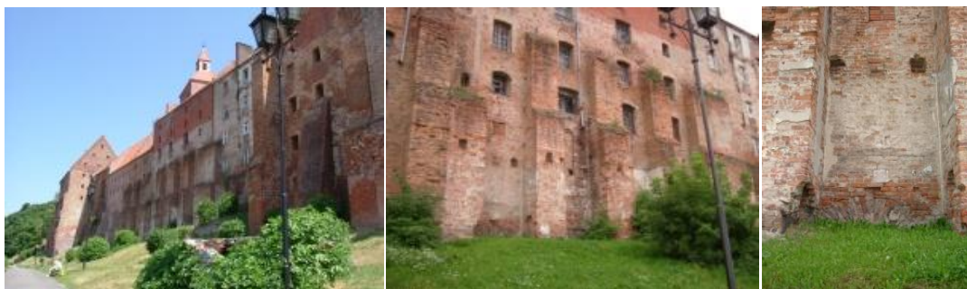
Ryc. 59. Spichrze kościelne. Widok w kierunku północnym. Zapewne pierwotnie stajnia lub obora między dwoma spichrzami, będącymi jednocześnie basztami. Ponad przyporami nadbudowy z XIX-XX w.

Dopiero z lotu ptaka widać, że spichrze przed kościołem św. Mikołaja to faktycznie jeden obiekt architektoniczny, który posiadał na skrzydłach dwie baszty o wymiarach około 15 X 15 m. W środku na odcinku 26 m, między przyporami jest 6 furt, (ryc. 59-61).