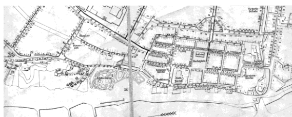
Ryc. 127. Plan Beckera 1897 r.

Historycznie ukształtowana siatka dróg i ulic, linie umocnień z czasów średniowiecza są bardzo czytelne też jeszcze na planach z końca XIX w., (rys. 126). Plany te były zapewne pomocne przy opracowywaniu planów rekonstrukcyjnych, (ryc. 93) 2 .