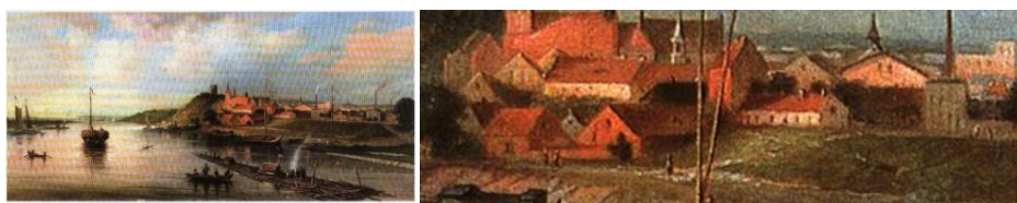
Ryc. 128-129. Widok Grudziądza nad Wisłą, 1896 r. G. Breuning i kadr z obrazu z widokiem na młyn z klasztorem.

Wyjaśnienie trwałości tych linii po stronie południowej jest zapewne na obrazie G. Breuninga z 1896, (ryc. 128-129) 3 .