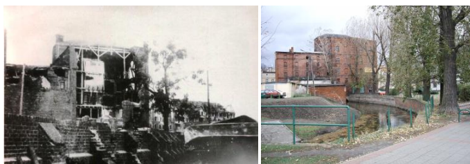
Ryc. 133. Młyn Górny w 1945 r.

Podobnie jak Młyn Dolny, umocniony był Młyn Górny. Do 1945 r. był czytelny mur z przyporami okalający ten młyn, (ryc. 133-134).