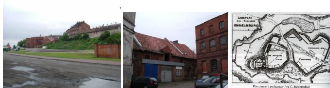
Ryc. 130. Widok terenu dawnego Młyna Dolnego z 2009 r. od strony południowo-zachodniej.