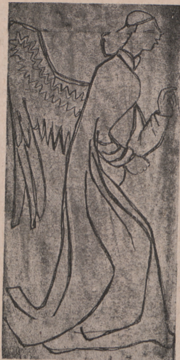
Zygmunt Turkiewicz SZKIC Z MUZEUM