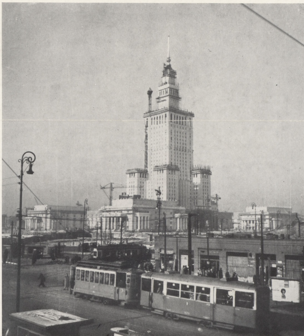
Le Palais Staline de la Culture et de la Science, don de l'U.R.S.S. à la Pologne, commencé en avril 1952, domine la ville de Varsovie.