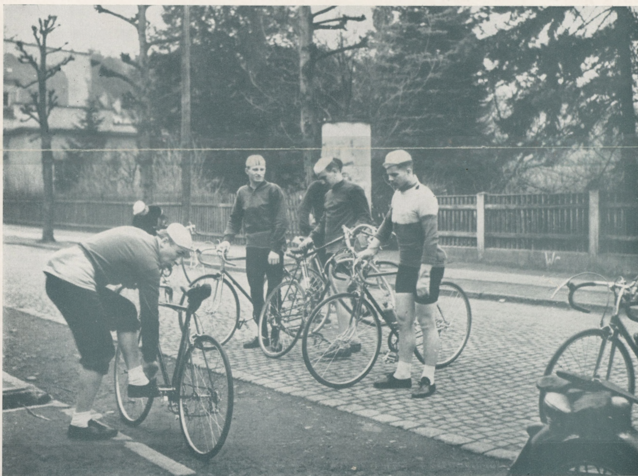
La Sélection polonaise pour la "Course de la Paix" à l'entraînement