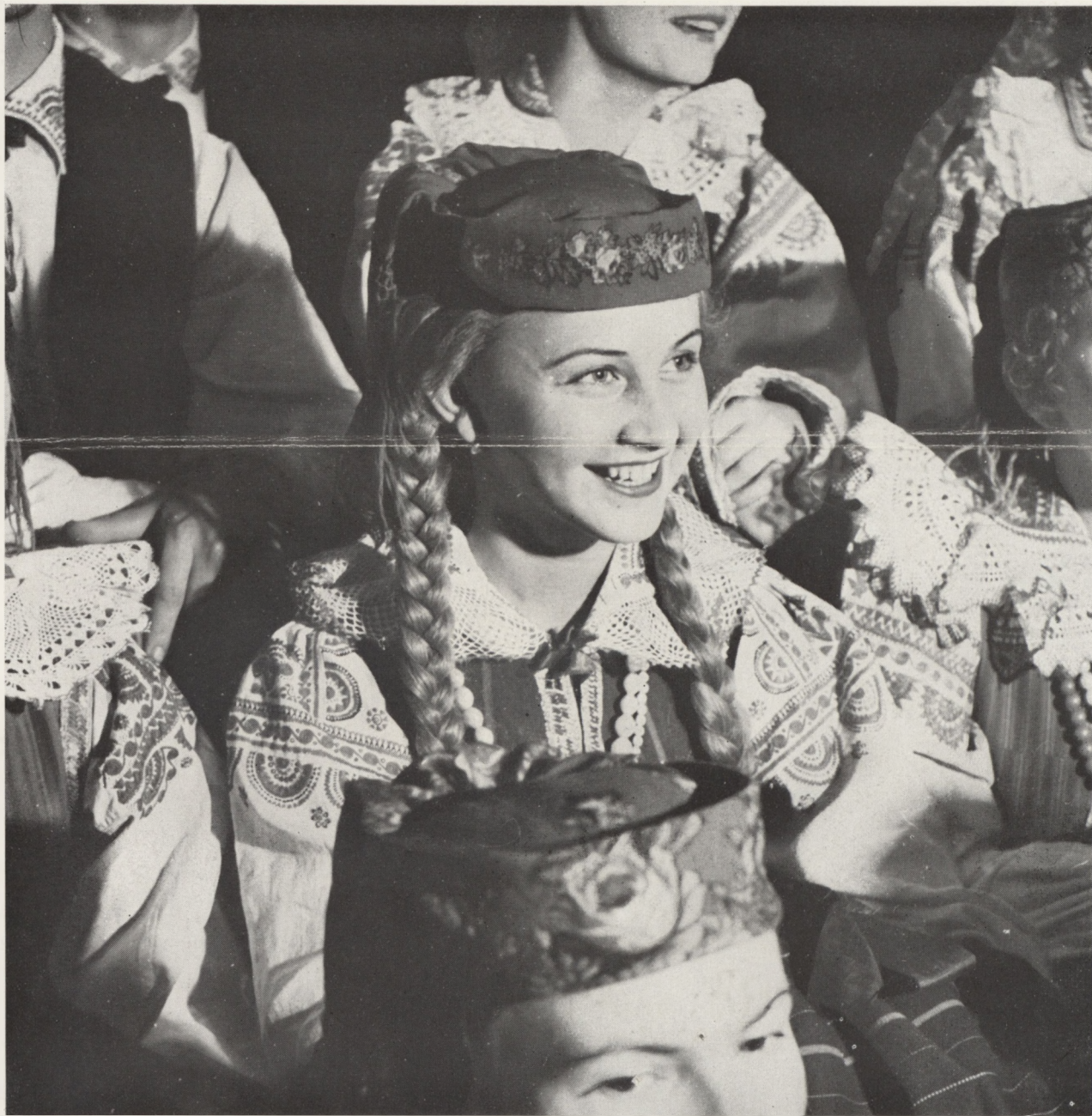
Une charmante artiste de l'ensemble "Mazowsze" de Chants et Danses Folkloriques qui se produit actuellement au Palais de Chaillot.