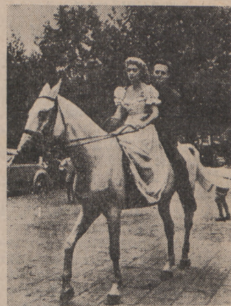
MARTINE CAROL Francuska aktorka filmowa Martine Carol, która grała główną rolę w filmie „Caroline Cherie”...