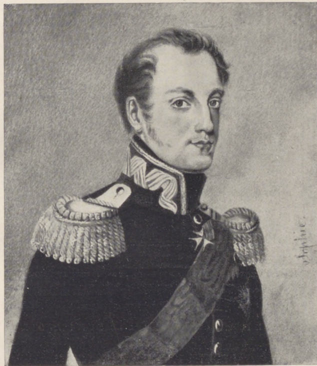
ИМПЕРАТОРЪ НИКОЛАЙ I ВЪ МУНДИРЬ ПОЛЬСКИХЪ ВОЙСКЪ.