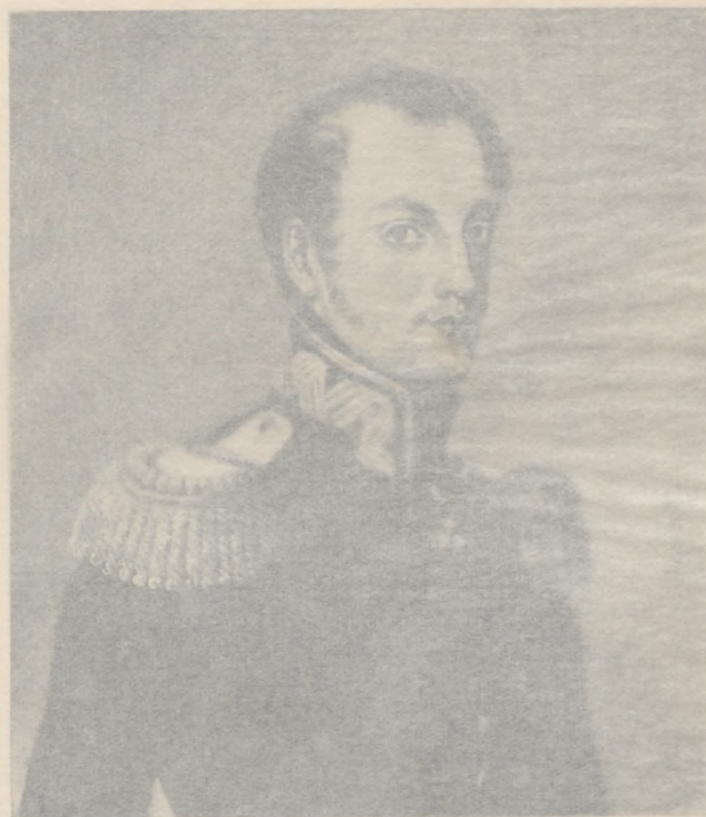
ИМПЕРАТОРЪ НИКОЛАЙ I ВЪ МУНДИРЪ ПОЛЬСКИХЪ ВОЙСКЪ.