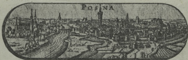
Posen vers 1650