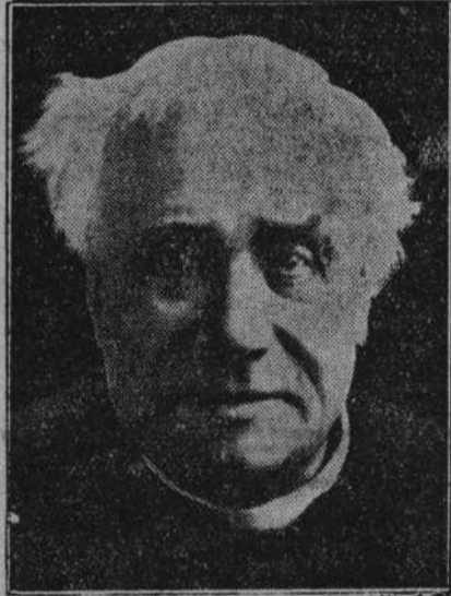
Ks. kardynał Lucon †

Jak już donosiliśmy zmarł 28 maja arcybiskup z Reims ks. kardynał Lucon w 88 roku życia.